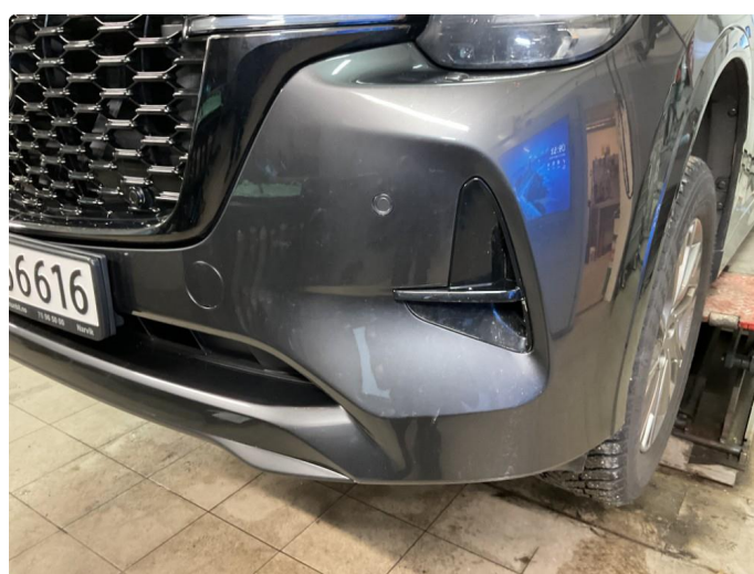
1.4 Noen små steinsprang i støtfanger foran