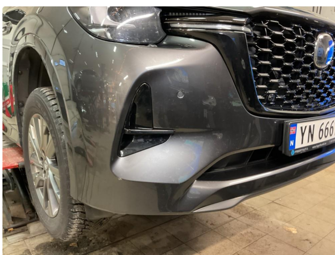
1.4 Noen små steinsprang i støtfanger foran