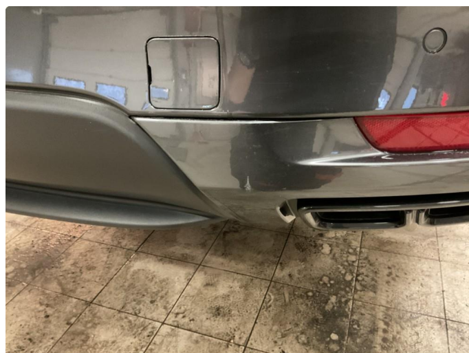
1.3 Liten/ripe lakksår i plast