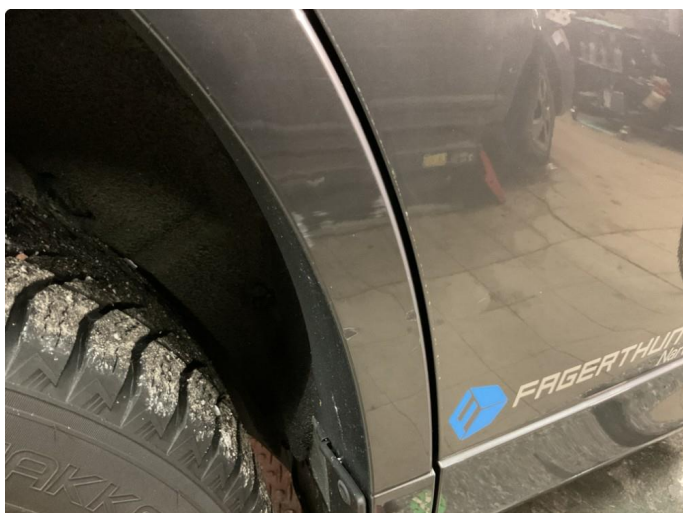
1.2 Liten ripe+ lakksår