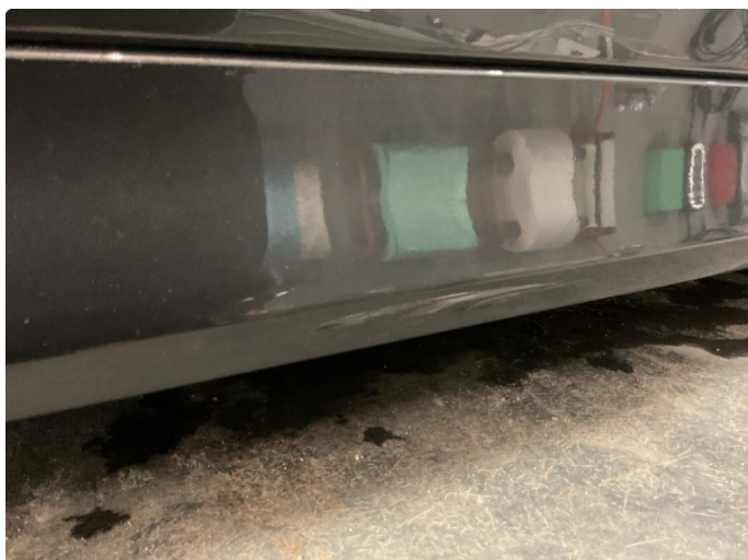
1.1 Ripe i plast venstre fordør nedre del