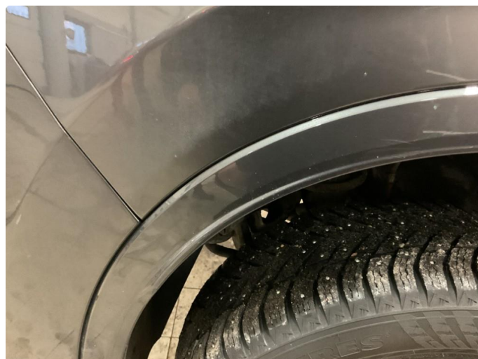
1.2 Liten ripe+ lakksår