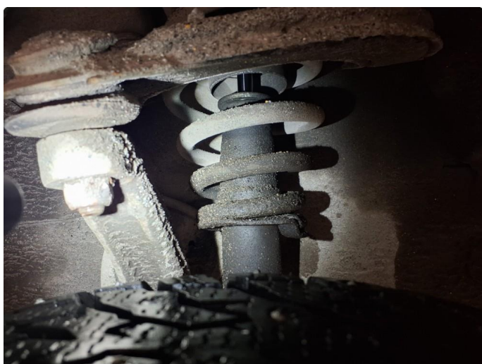
5.1 Støtdemper lekkasje