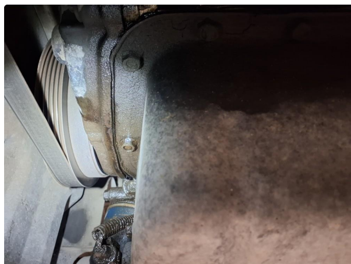
4.3 Oljelekkasje i forkant