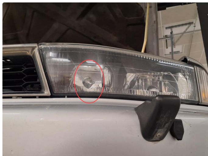
3.1 Defekt/sprukket glass