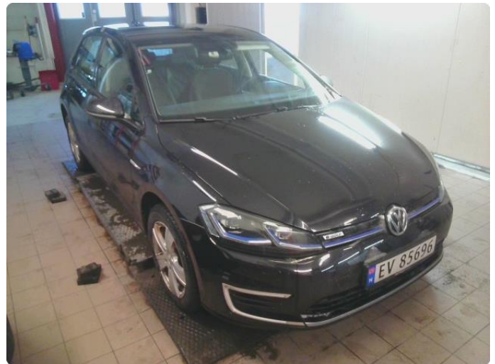
2.1 Bilder av bilen Diverse Steinsprut og riper