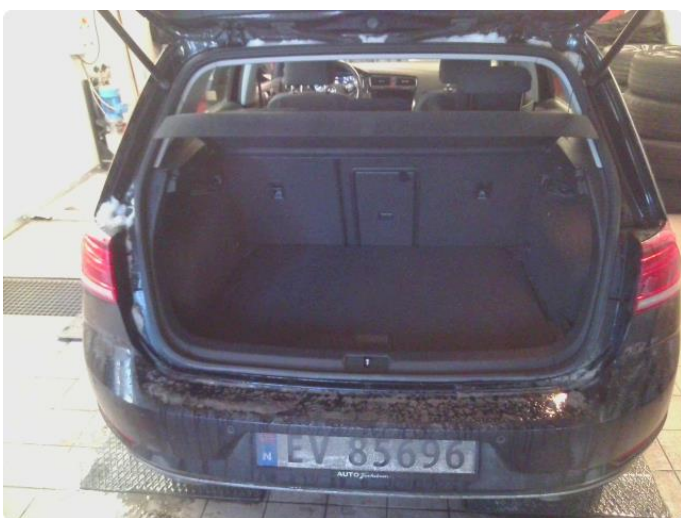
2.1 Bilder av bilen Diverse Steinsprut og riper