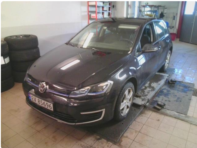
2.1 Bilder av bilen Diverse Steinsprut og riper