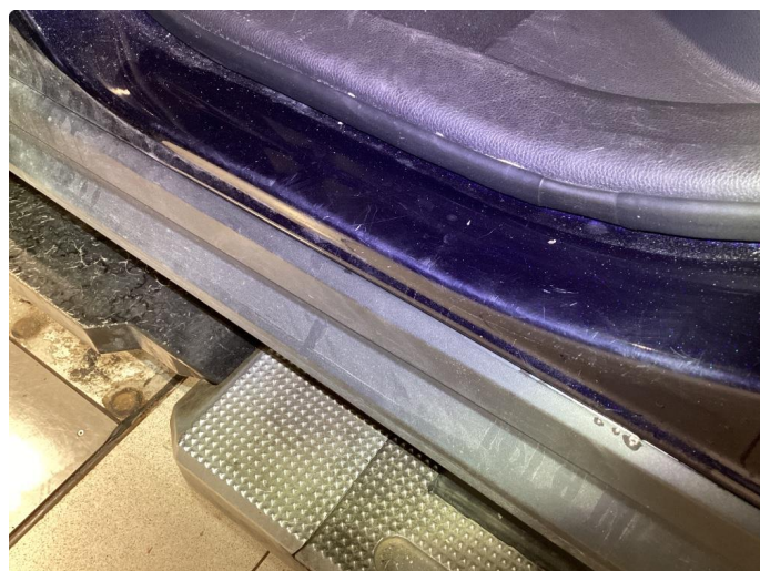
1.3 Slitt innsteg