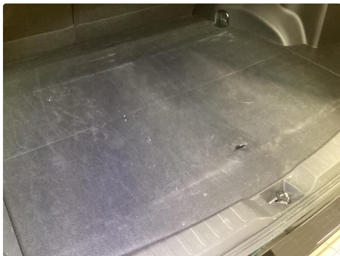
2.2 Bagasjeromsteppe skadet