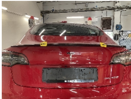
2. Lakk / karosseri utvendig