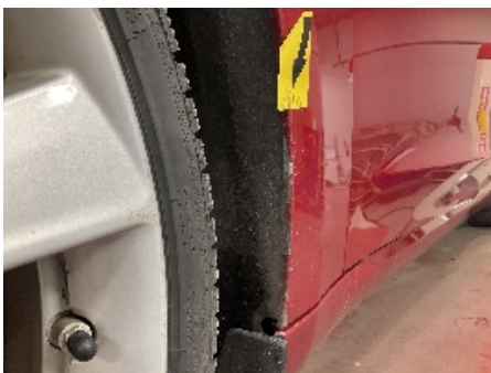
4. Lakk / karosseri utvendig