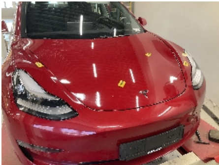
1. Lakk / karosseri utvendig