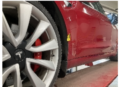
3. Lakk / karosseri utvendig