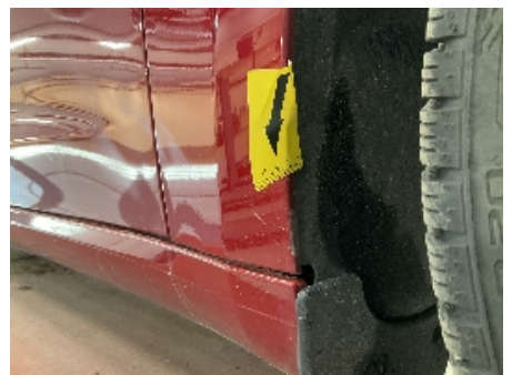
6. Lakk / karosseri utvendig