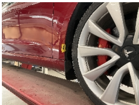
5. Lakk / karosseri utvendig