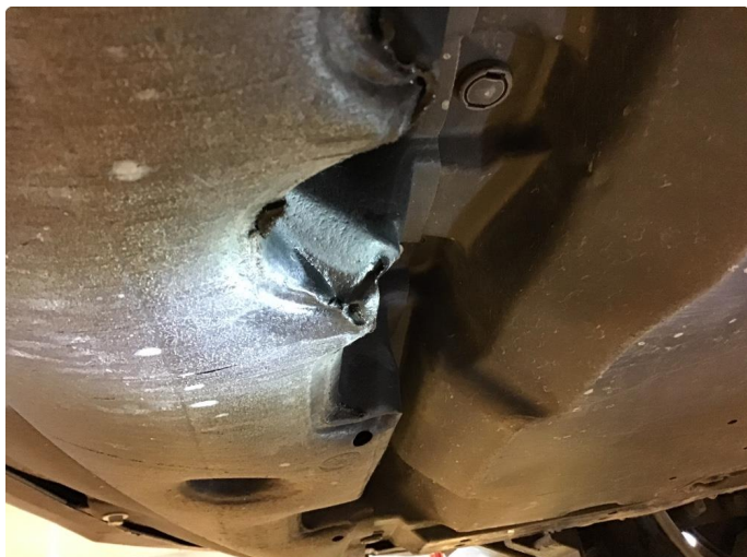
1.1 Beskyttelsesplate skadet/mangler