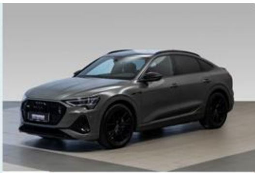
FRYDENBØ | Ålesund

Se mer om forutsetningene for vurderingen og andre vilkår på siste side.