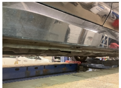
9. Lakk / karosseri utvendig