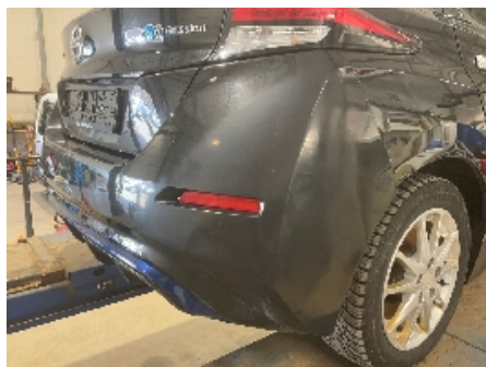
8. Lakk / karosseri utvendig