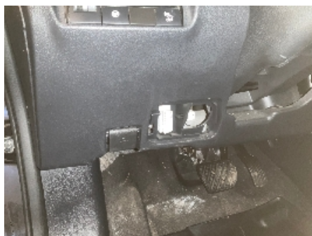
11. Interiør generelt