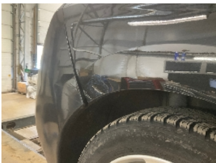
7. Lakk / karosseri utvendig