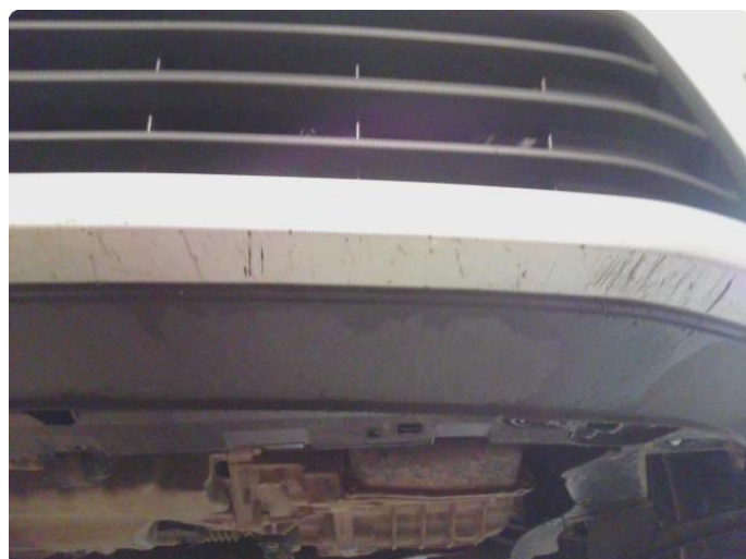
1.2 Riper i underkant