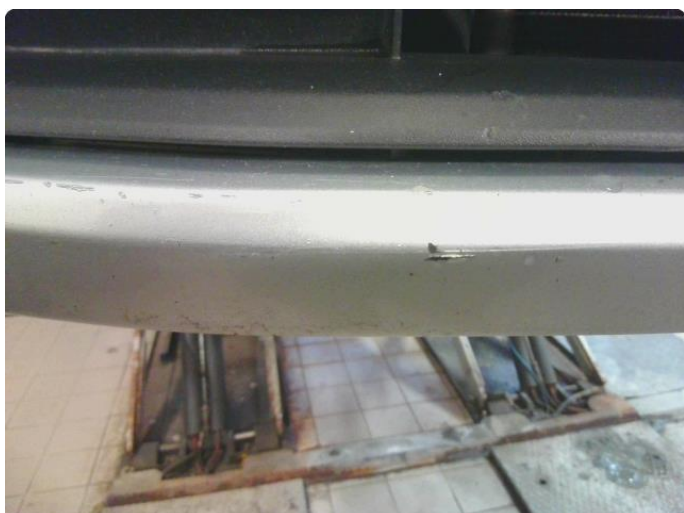
1.2 Riper i underkant