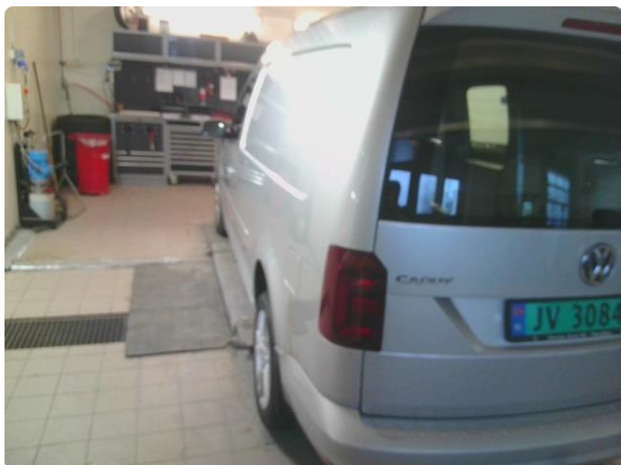
3.1 Bilder av bilen