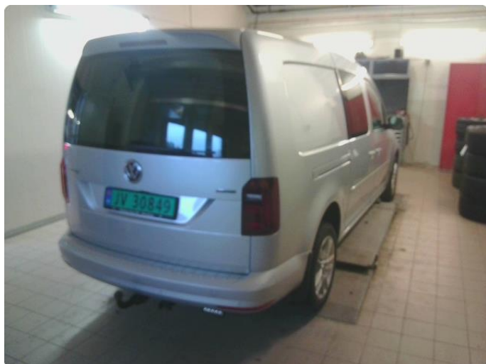
3.1 Bilder av bilen