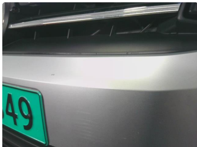
1.2 Riper i underkant