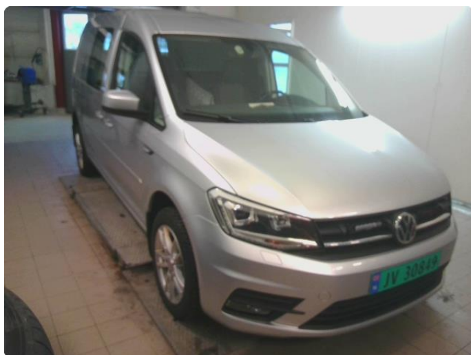
3.1 Bilder av bilen