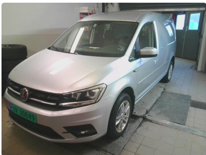
3.1 Bilder av bilen