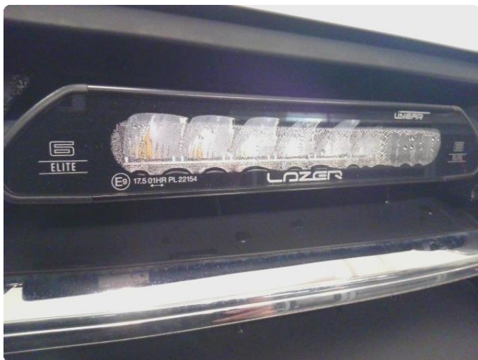
2.1 Litt fukt i ekstra lys men fungerer