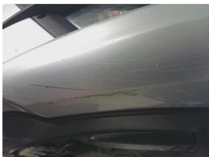
1.2 Riper i underkant