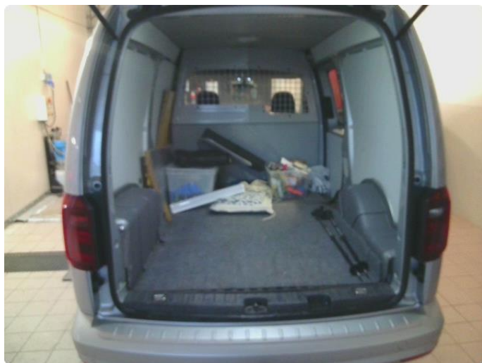
3.1 Bilder av bilen