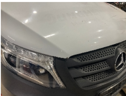
4. Lakk / karosseri utvendig