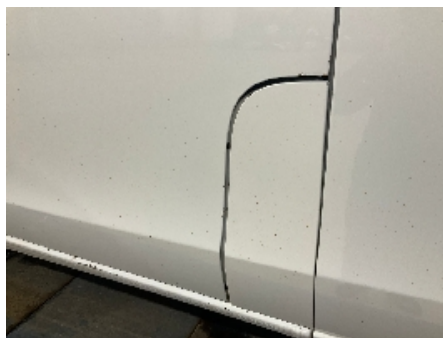
5. Lakk / karosseri utvendig