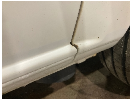
2. Lakk / karosseri utvendig