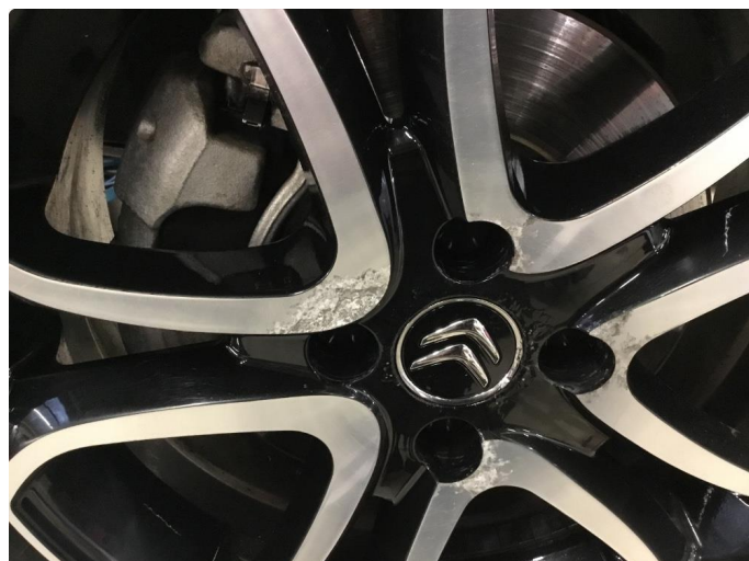
1.2 Korrosjon på vinterfelger