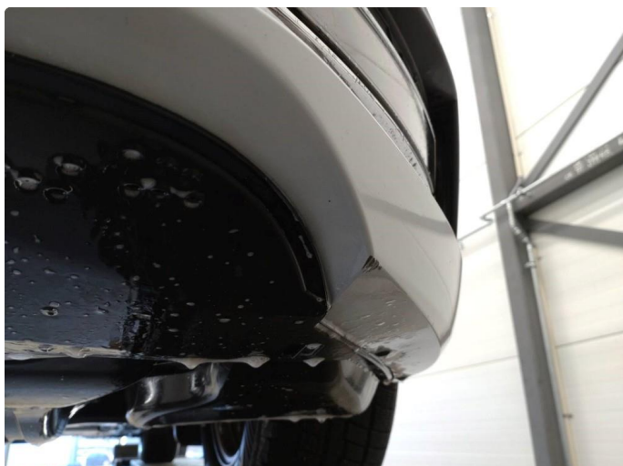
1.1 Skrubbskader underkant