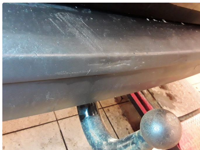
1.6 Noen riper og sår.