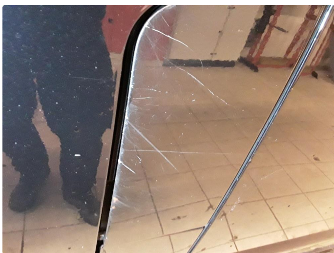
1.7 Noen riper.