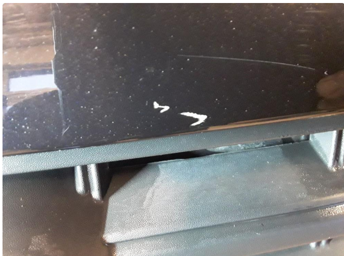
1.3 Noen riper og steinsprut.