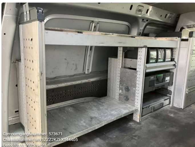
2.1 Noe bruksslitasje