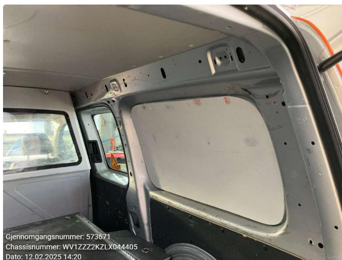
2.1 Noe bruksslitasje