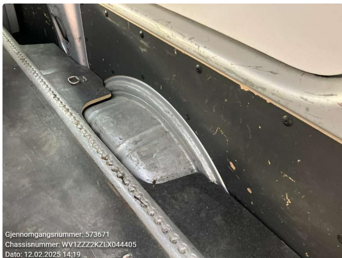
2.1 Noe bruksslitasje