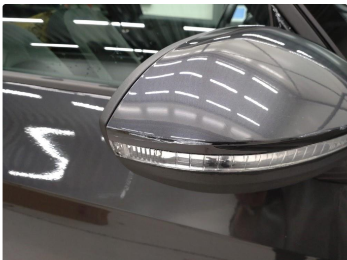
1.1 Deksel skadet/ripe