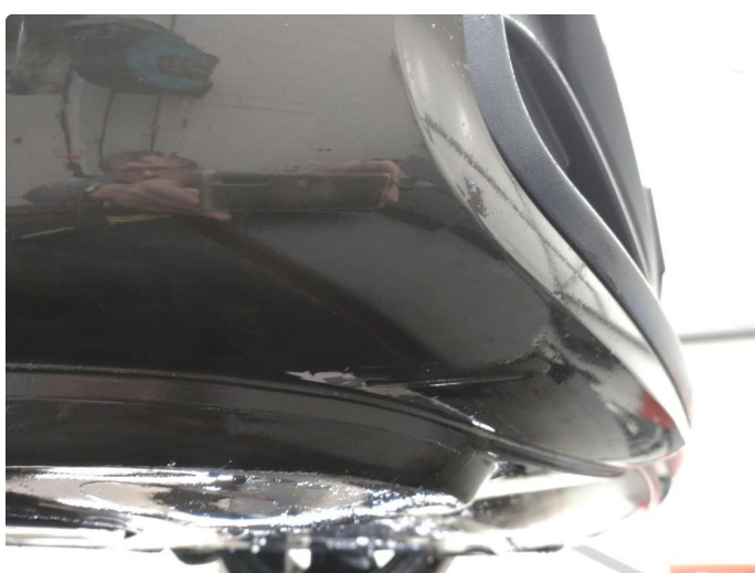
1.4 Skrubbskader underkant