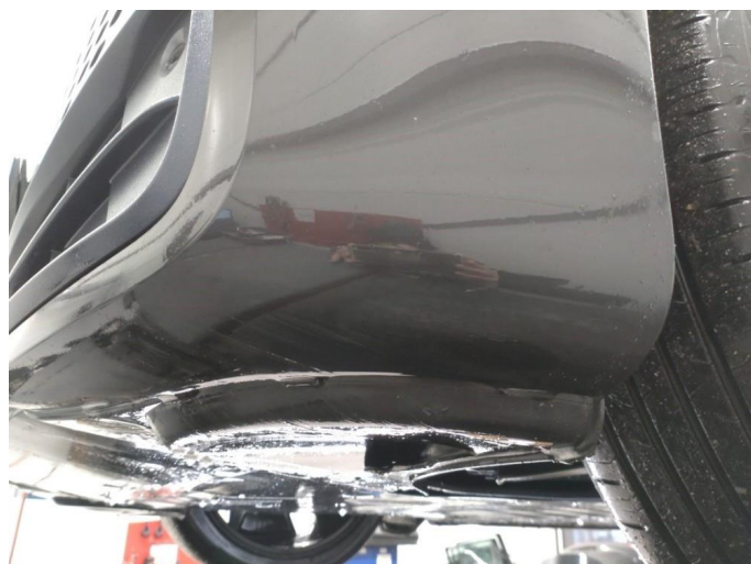
1.4 Skrubbskader underkant