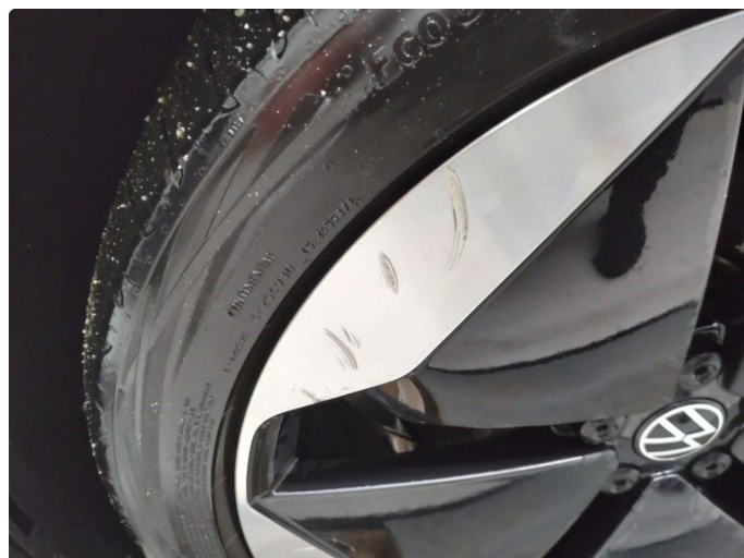
1.2 Ripe (r) gjennom lakk