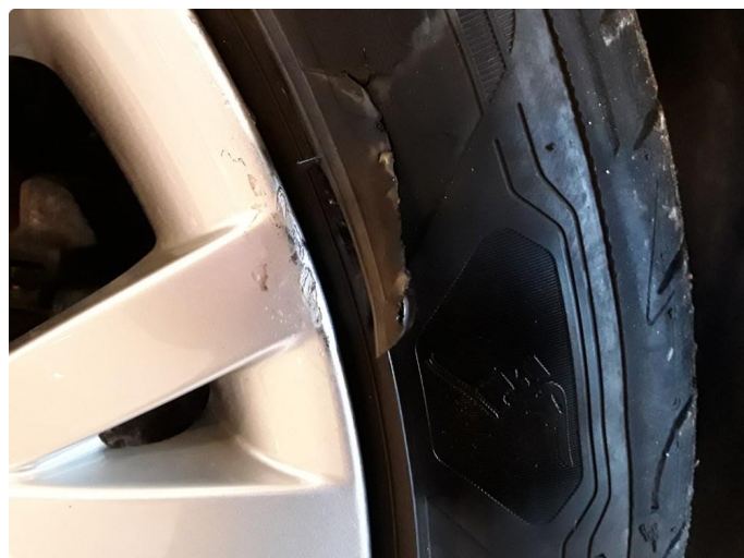
1.2 2 noe kantkjørte sommerfelger.