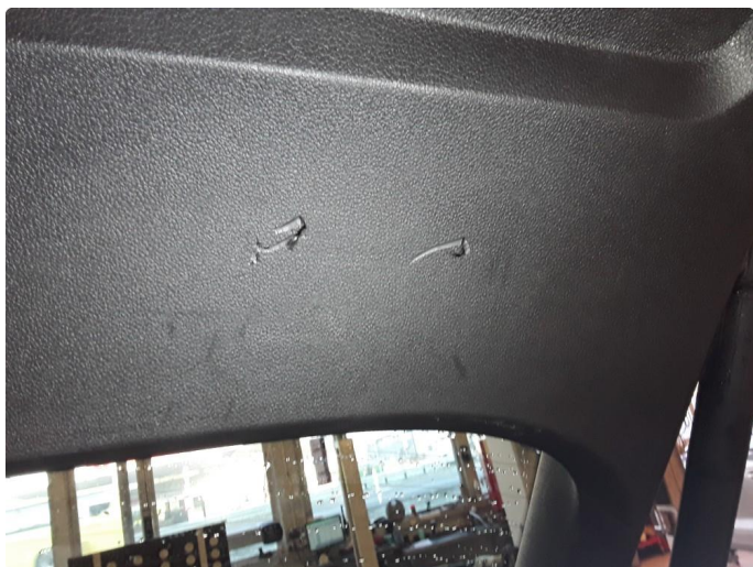
2.1 Noe sår på bakluketrekk.