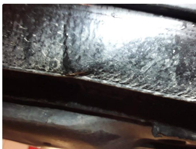
1.4 Liten bulk.