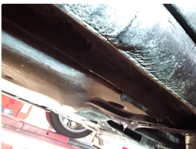
1.4 Liten bulk.