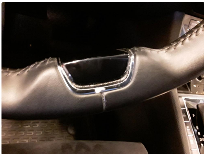
2.3 Sår i ratt.