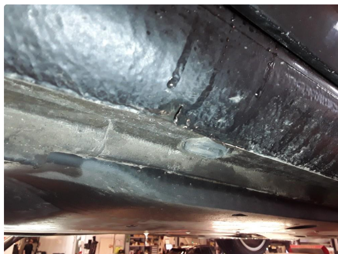
1.3 Liten bulk.