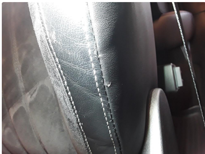
2.2 Noe slitasje på setetrekk venstre foran.