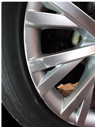
1.2 2 noe kantkjørte sommerfelger.