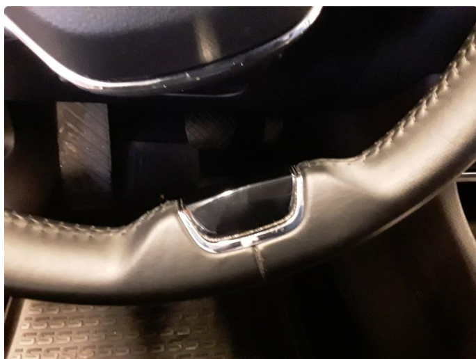
2.3 Sår i ratt.