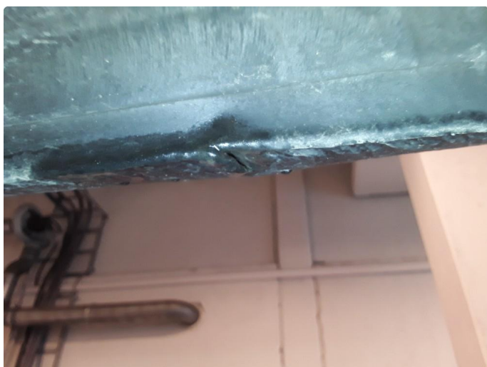
1.3 Liten bulk.