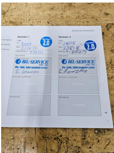
2.2 Komplet servicehistorikk + tannreim/vannpumpe-skiift utført (alt hos merkeforhandler)