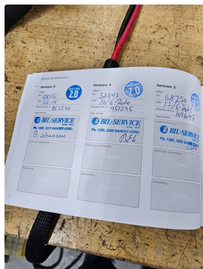
2.2 Komplet servicehistorikk + tannreim/vannpumpe-skiift utført (alt hos merkeforhandler)