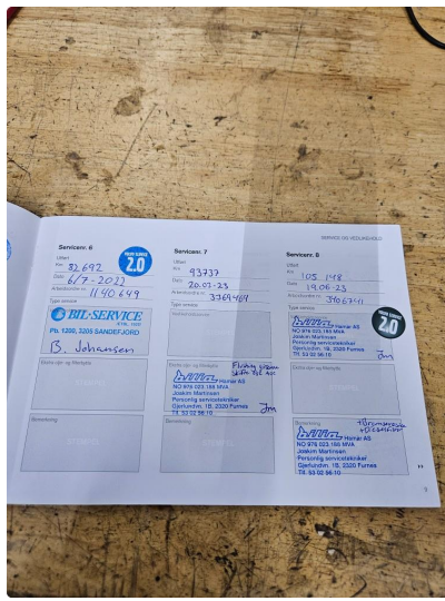
2.2 Komplet servicehistorikk + tannreim/vannpumpe-skift utført (alt hos merkeforhandler)