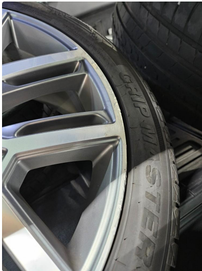
1.1 Noe skrubbermerker på alu. sommerfelger