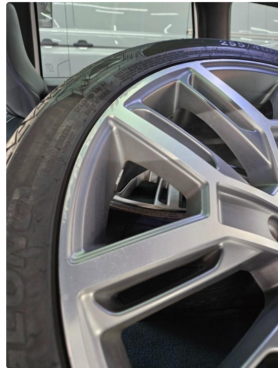
1.1 Noe skrubbermerker på alu. sommerfelger