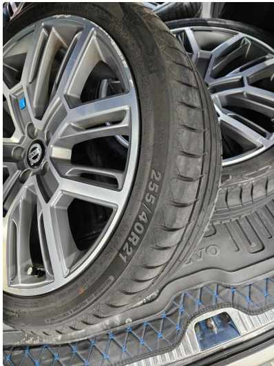
1.1 Noe skrubbermerker på alu. sommerfelger