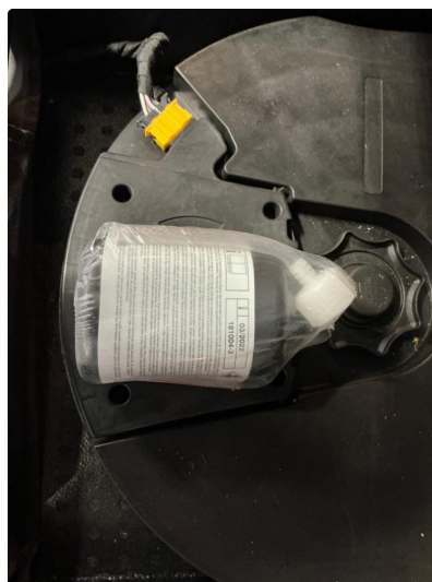
3.1 Dekktettemiddel utgått på dato