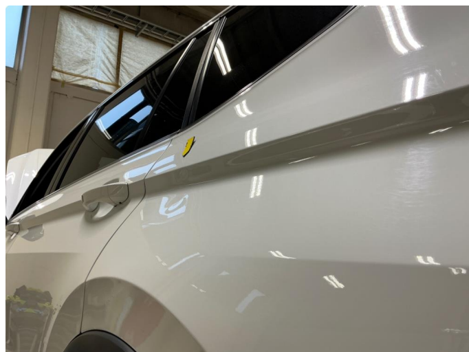
1.2 Bulk, venstre bakskjerm