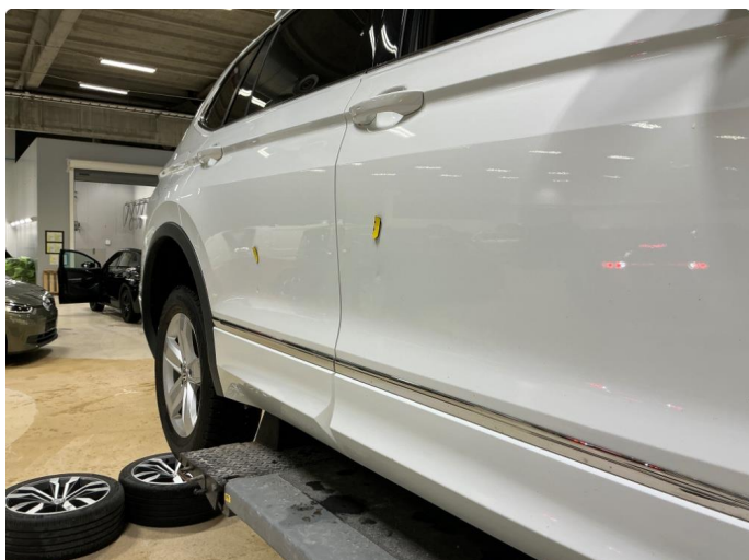
1.1 Flere p-bulker høyre og venstre dører