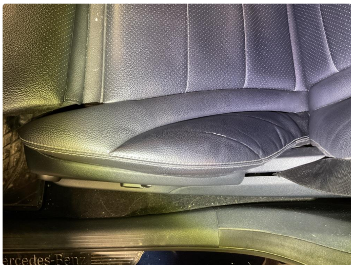
3.2 Skade på setetrekk