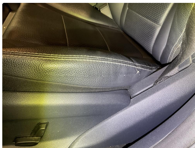
3.2 Skade på setetrekk