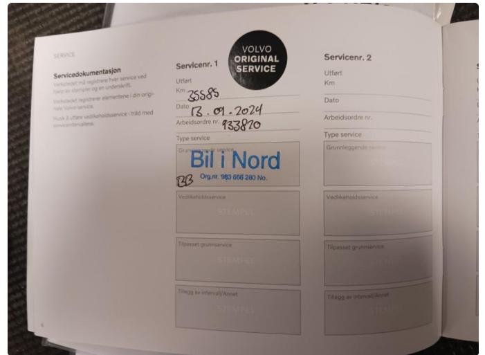
1.1 Dokumentert service, se bilde