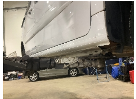
3. Lakk / karosseri utvendig