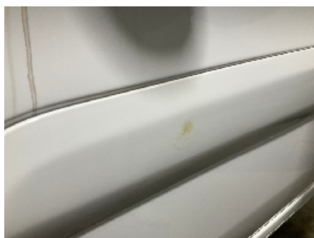
8. Lakk / karosseri utvendig