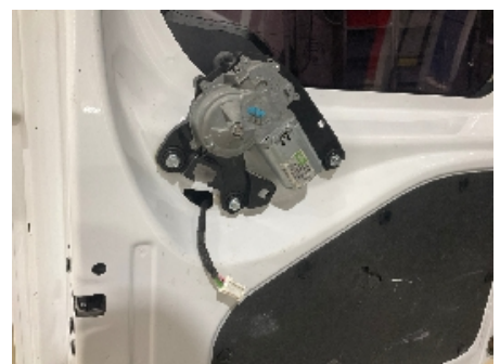
9. Vindusvisker, spylers (foran/bak)