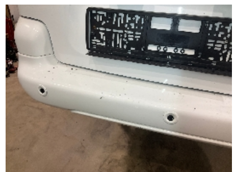
6. Lakk / karosseri utvendig