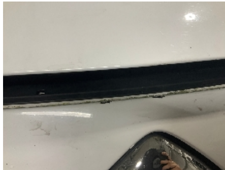
2. Lakk / karosseri utvendig