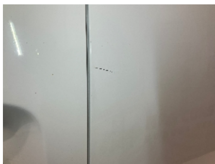
5. Lakk / karosseri utvendig