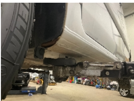
7. Lakk / karosseri utvendig