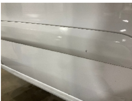
4. Lakk / karosseri utvendig