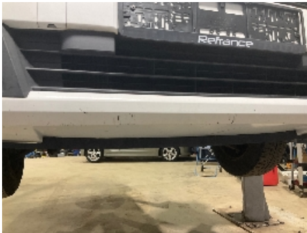
1. Lakk / karosseri utvendig