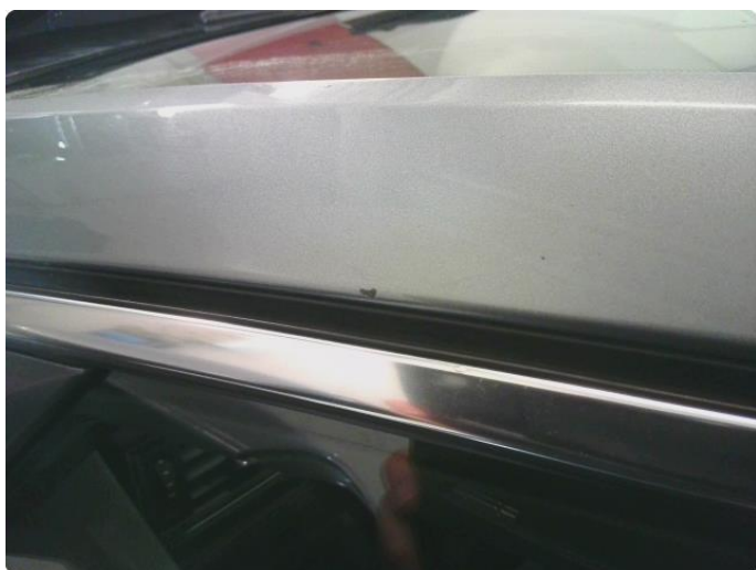
1.12 Ufagmessig utført arbeid