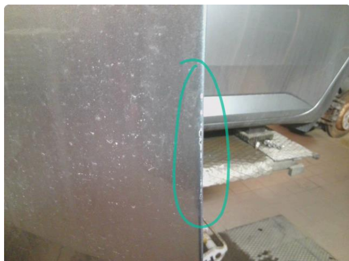
1.2 Lakk Skader