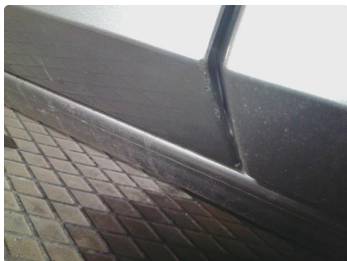
1.2 Lakk Skader