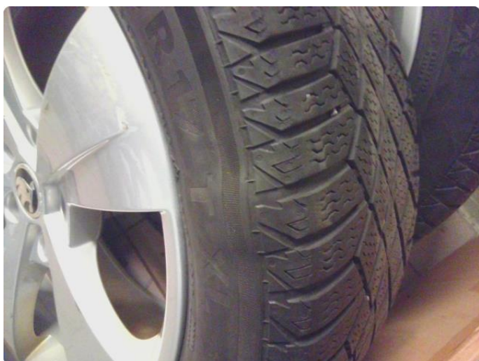
1.6 Dekkskade vinterhjul