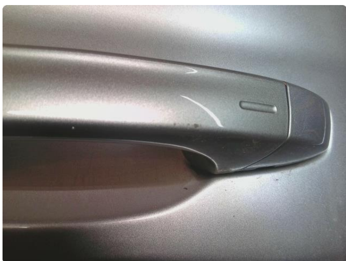
1.2 Lakk Skader