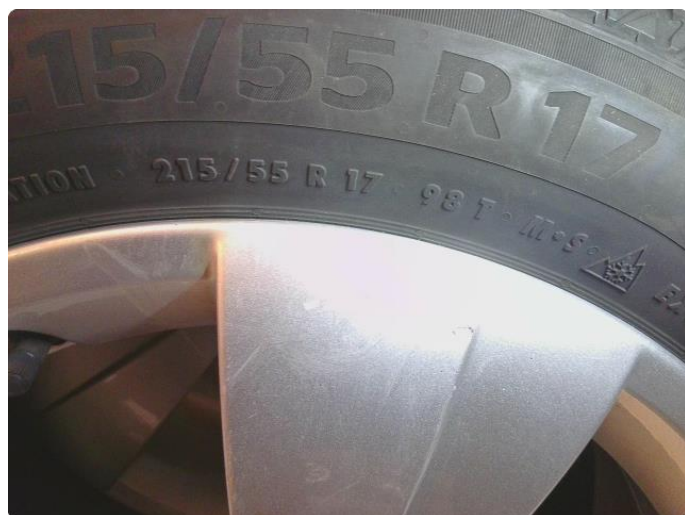
1.6 Dekkskade vinterhjul