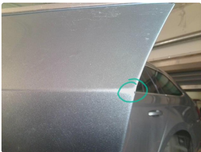
1.2 Lakk Skader