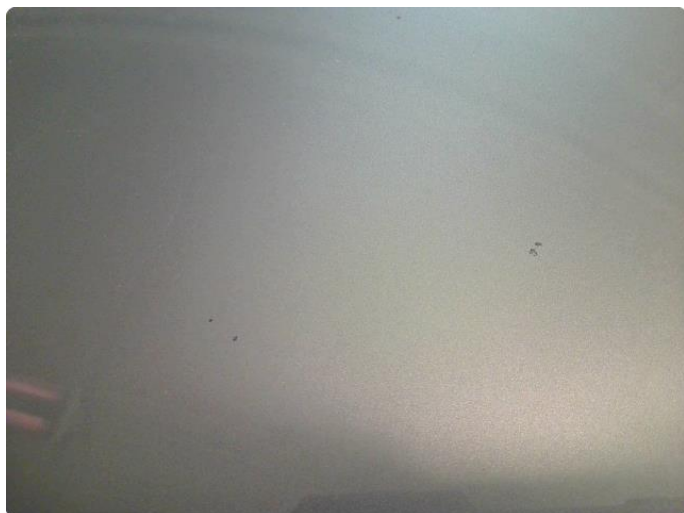
1.10 Steinsprut med lakk Skader