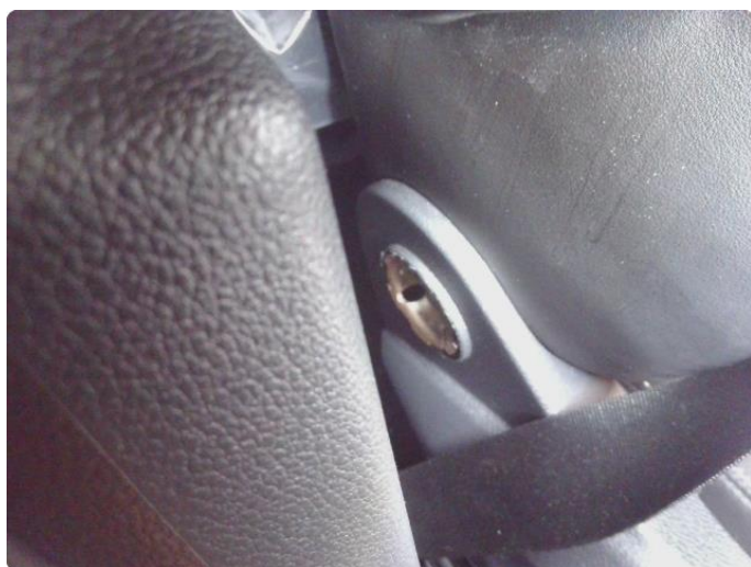
2.1 Feil på justeringsmekanisme