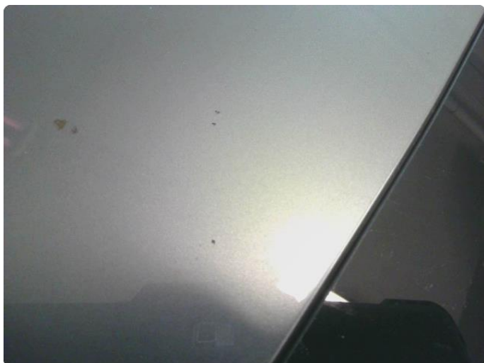
1.10 Steinsprut med lakk Skader