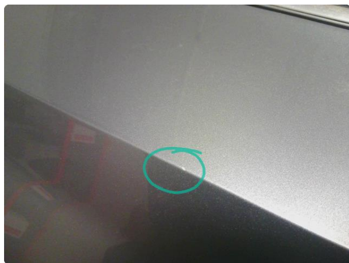
1.3 Lakk Skader