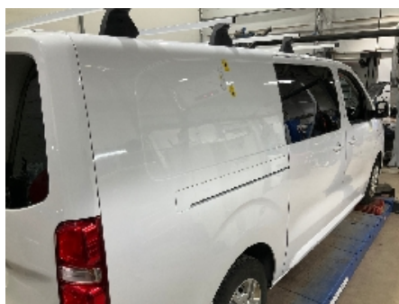
71. Lakk / karosseri utvendig