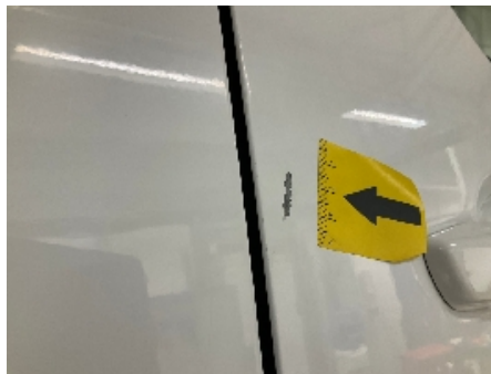
56. Lakk / karosseri utvendig