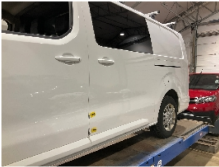
37. Lakk / karosseri utvendig