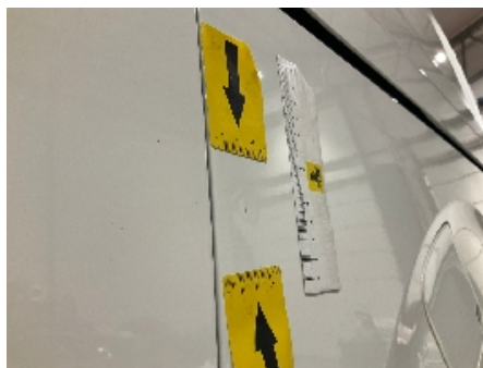
44. Lakk / karosseri utvendig