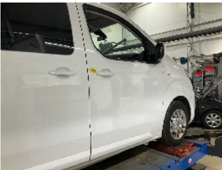
55. Lakk / karosseri utvendig