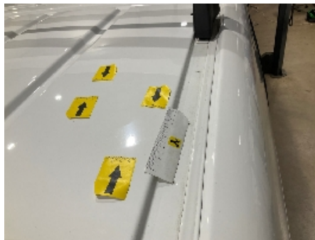
68. Lakk / karosseri utvendig