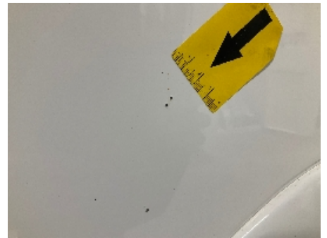
54. Lakk / karosseri utvendig