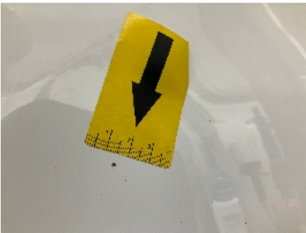
64. Lakk / karosseri utvendig