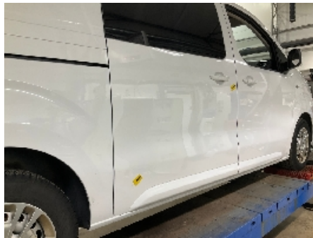
53. Lakk / karosseri utvendig