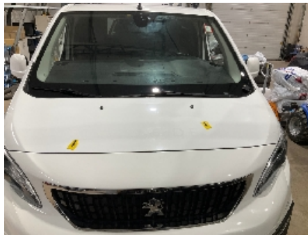
65. Lakk / karosseri utvendig