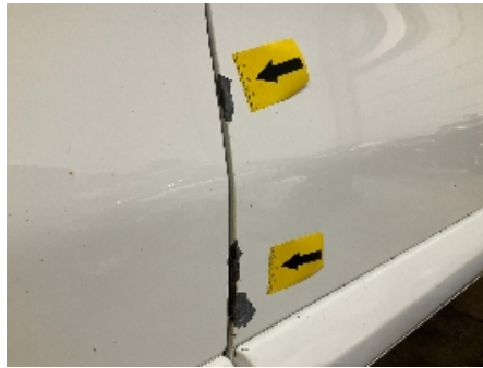
38. Lakk / karosseri utvendig