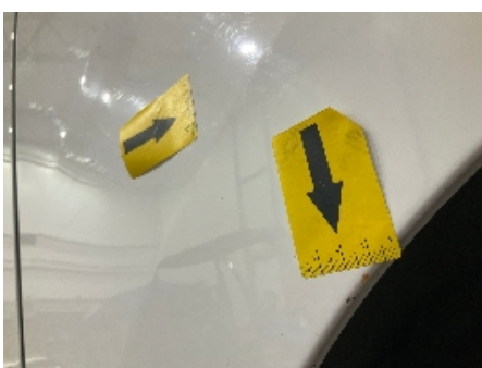
46. Lakk / karosseri utvendig