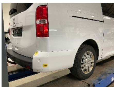
47. Lakk / karosseri utvendig