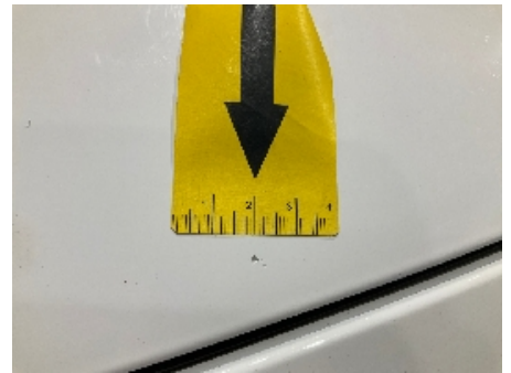
66. Lakk / karosseri utvendig