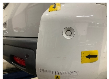
48. Lakk / karosseri utvendig