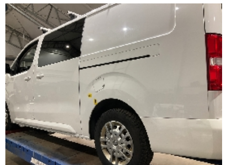
45. Lakk / karosseri utvendig