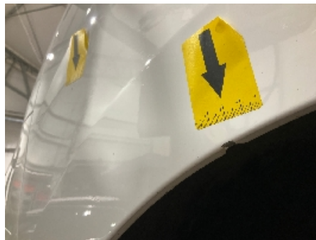
32. Lakk / karosseri utvendig