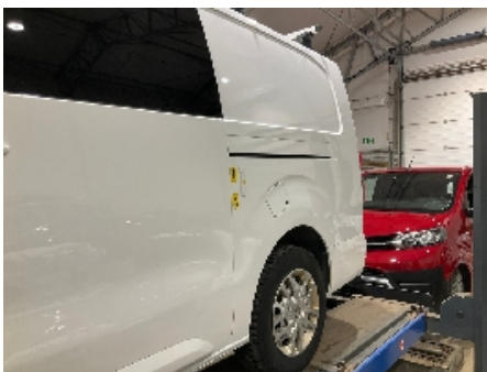
43. Lakk / karosseri utvendig