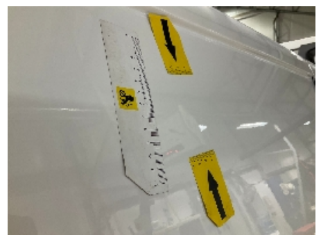
72. Lakk / karosseri utvendig