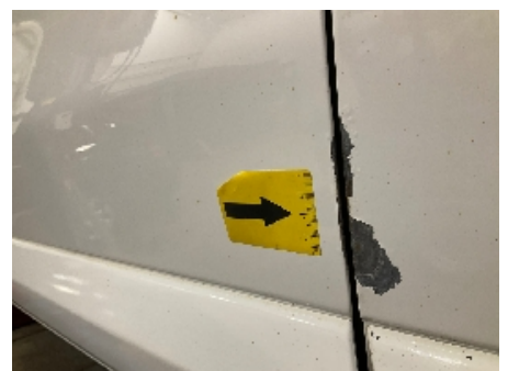
36. Lakk / karosseri utvendig