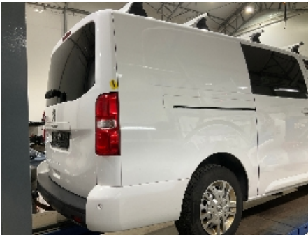
49. Lakk / karosseri utvendig