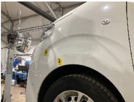
31. Lakk / karosseri utvendig