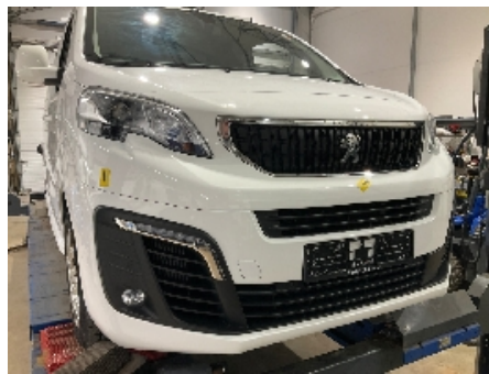
29. Lakk / karosseri utvendig