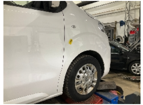
63. Lakk / karosseri utvendig