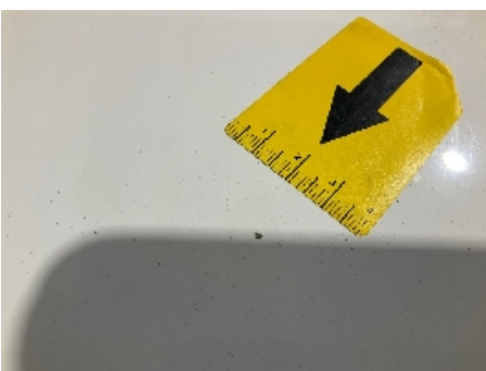
70. Lakk / karosseri utvendig