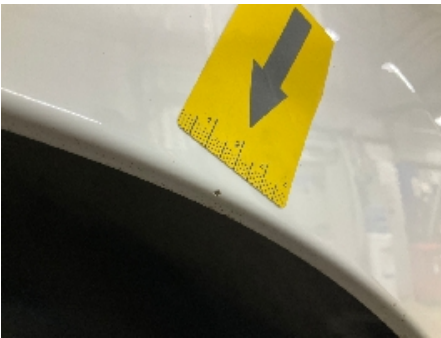
52. Lakk / karosseri utvendig