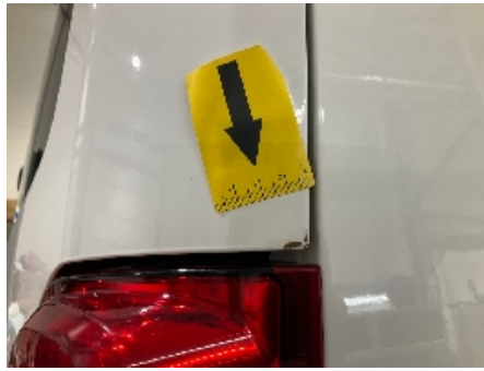
50. Lakk / karosseri utvendig