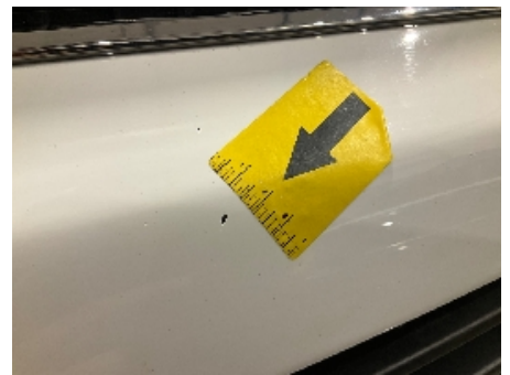
30. Lakk / karosseri utvendig