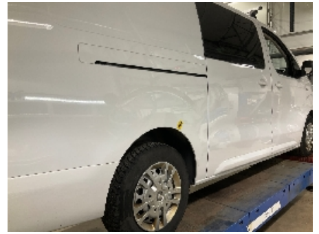
51. Lakk / karosseri utvendig