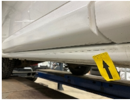
62. Lakk / karosseri utvendig