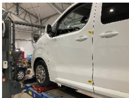
35. Lakk / karosseri utvendig