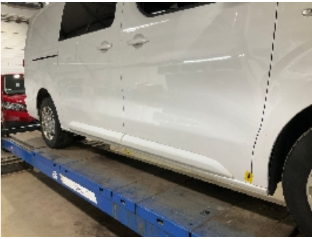
61. Lakk / karosseri utvendig