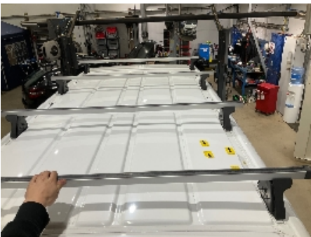
67. Lakk / karosseri utvendig