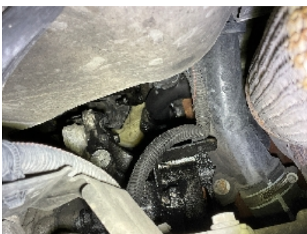
22. Utvendig tilstand motor