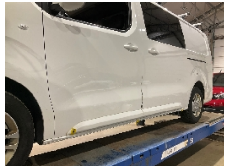
33. Lakk / karosseri utvendig