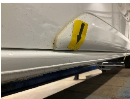
34. Lakk / karosseri utvendig