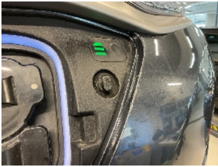
37. Ladekontakt elbil/hybrid