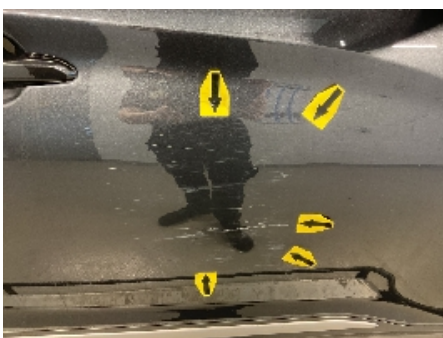
22. Lakk / karosseri utvendig