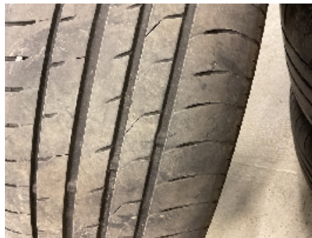
32. Ekstra hjulsett