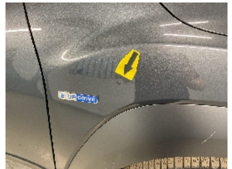
21. Lakk / karosseri utvendig