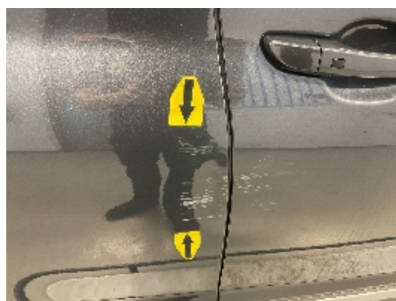
23. Lakk / karosseri utvendig