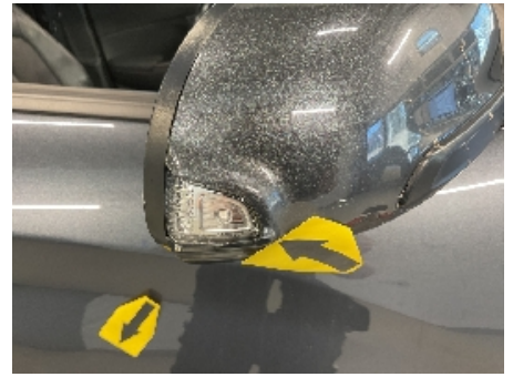
27. Utvendig speil