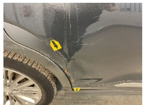
24. Lakk / karosseri utvendig