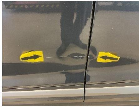
26. Lakk / karosseri utvendig