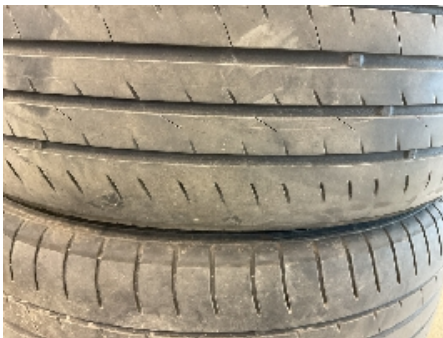
31. Ekstra hjulsett