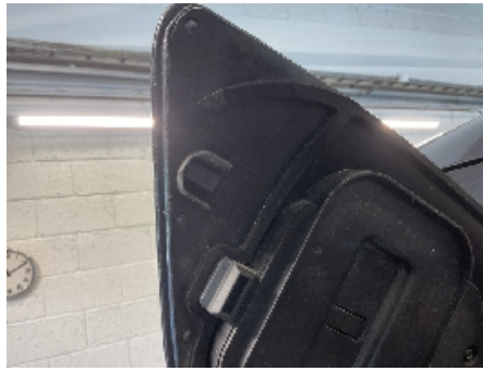
38. Ladekontakt elbil/hybrid