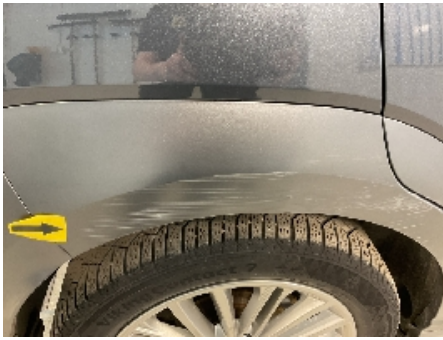
25. Lakk / karosseri utvendig