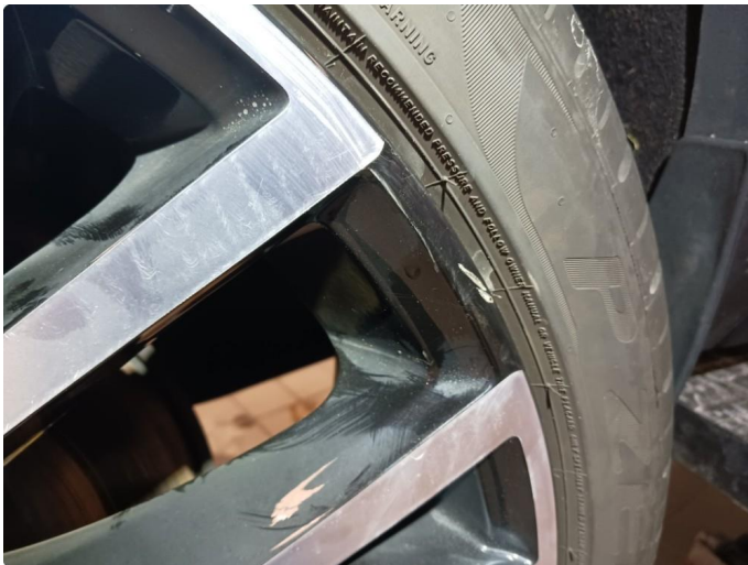
2.1 Kantkjørt felg