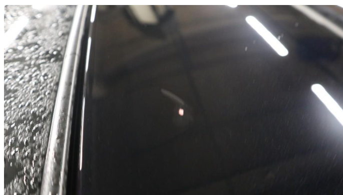
1.2 Steinsprut med rust