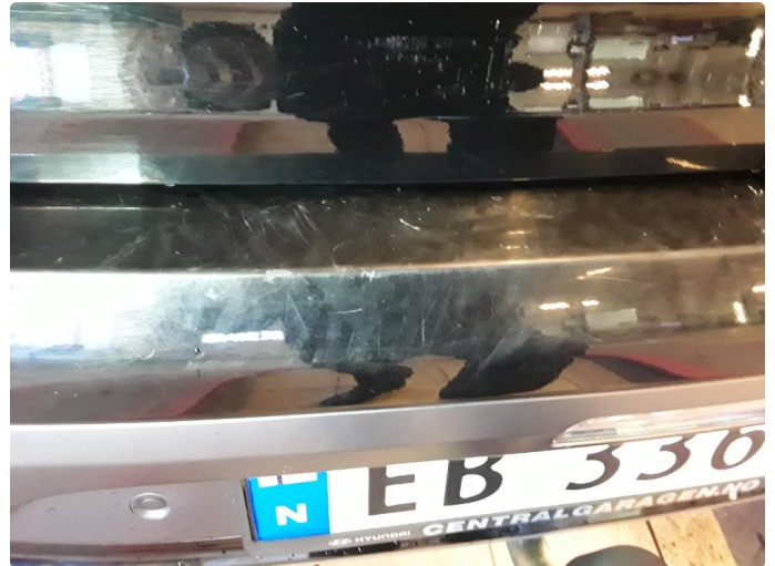
1.3 Noen riper og sår øvre del.