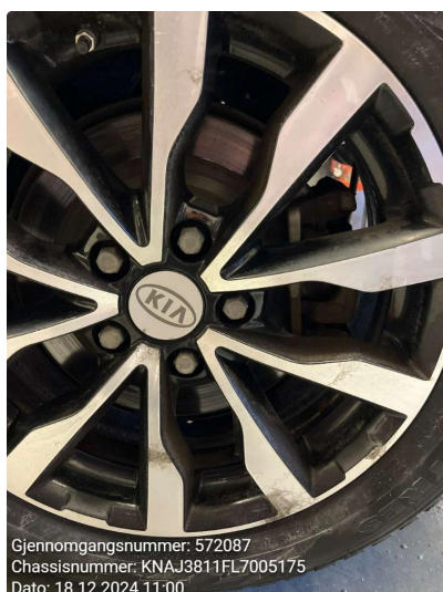
1.2 Påbegynnende oksidering