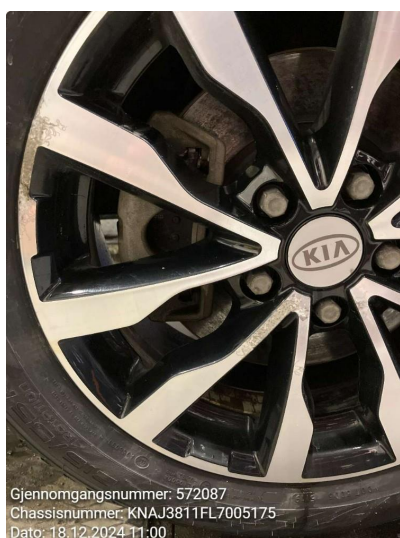
1.2 Påbegynnende oksidering