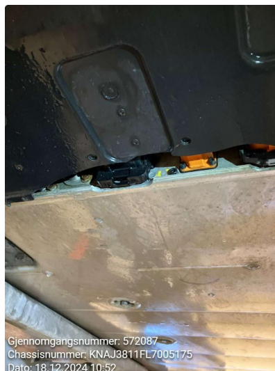
1.1 Beskyttelsesplate skadet/mangler