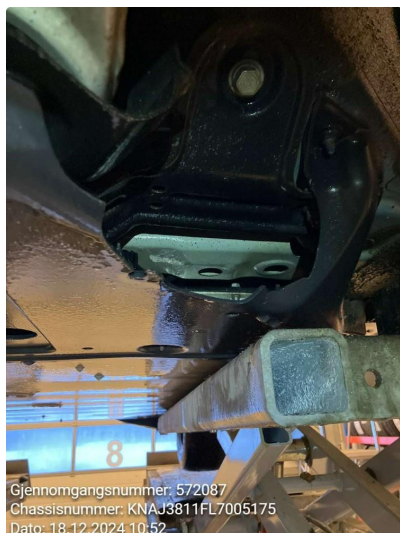
1.1 Beskyttelsesplate skadet/mangler