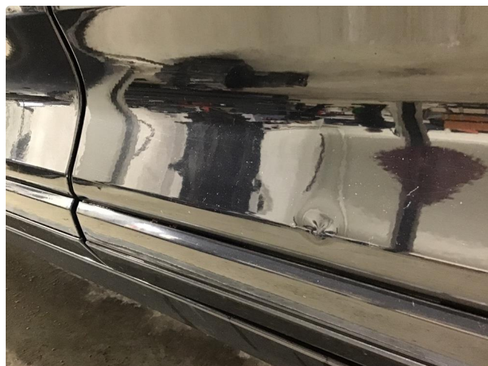
1.2 Bulk med lakkskade