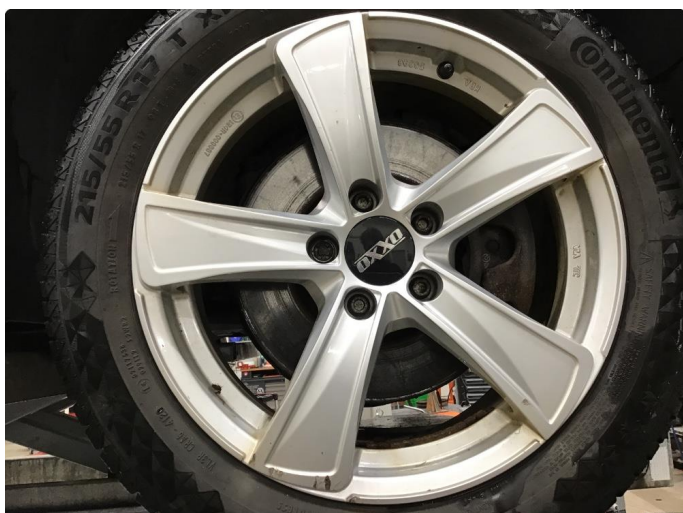
1.3 Kantkjørt felg