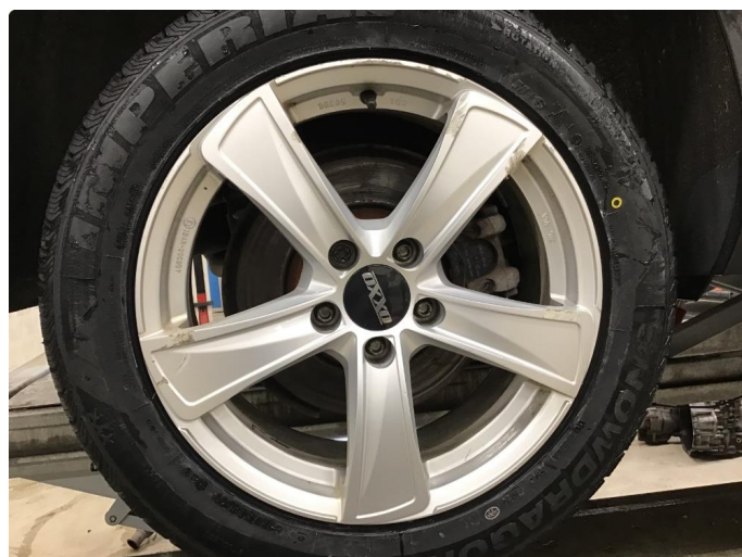
1.3 Kantkjørt felg