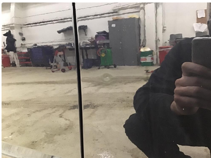
1.1 Bulk med lakkskade