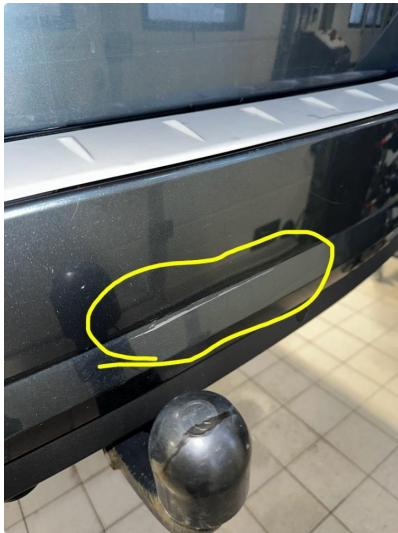
1.2 Bruks merker