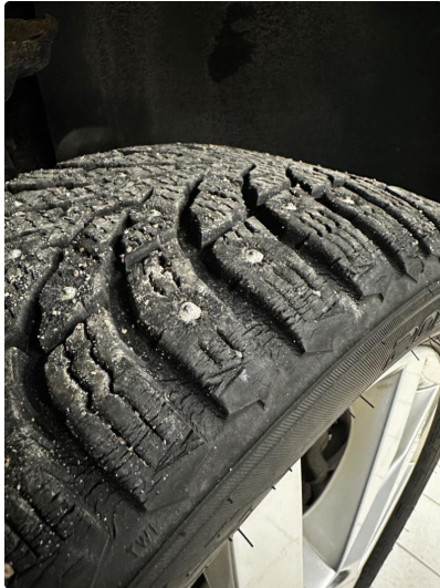
1.1 Noen sprekker