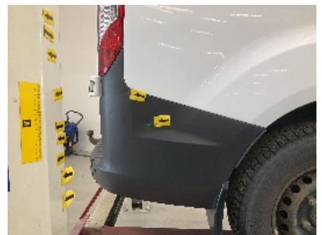
21. Lakk / karosseri utvendig