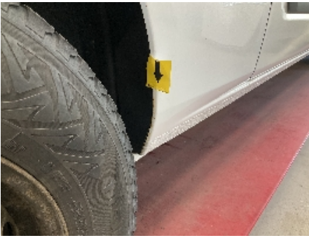
25. Lakk / karosseri utvendig