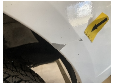
30. Lakk / karosseri utvendig