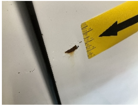
14. Lakk / karosseri utvendig