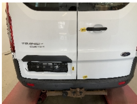
11. Lakk / karosseri utvendig