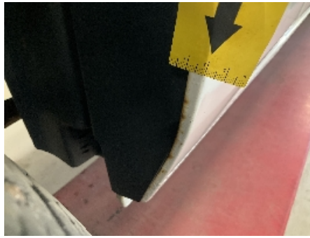
26. Lakk / karosseri utvendig