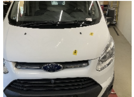
3. Lakk / karosseri utvendig