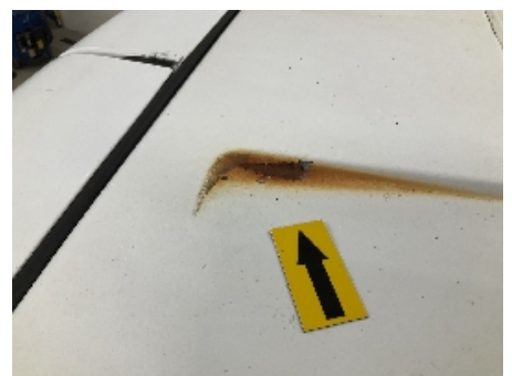
6. Lakk / karosseri utvendig