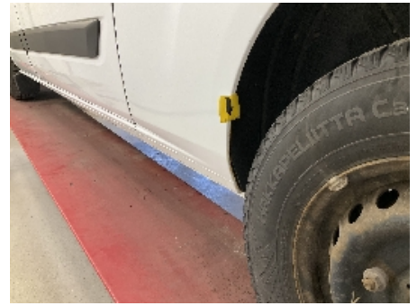
27. Lakk / karosseri utvendig