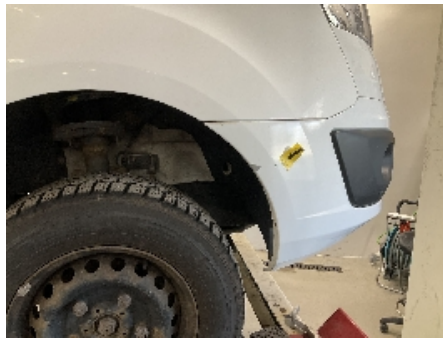
29. Lakk / karosseri utvendig