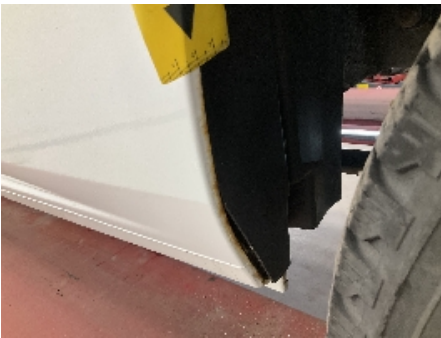
28. Lakk / karosseri utvendig