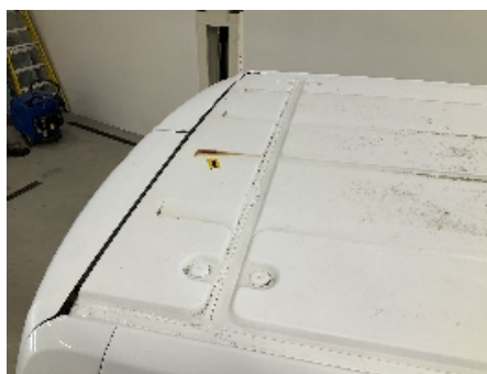
5. Lakk / karosseri utvendig