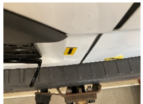
12. Lakk / karosseri utvendig