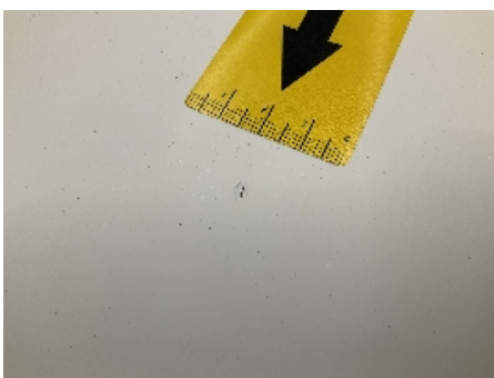
4. Lakk / karosseri utvendig