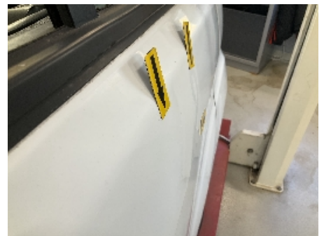
18. Lakk / karosseri utvendig