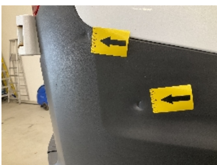
22. Lakk / karosseri utvendig