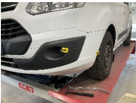
19. Lakk / karosseri utvendig