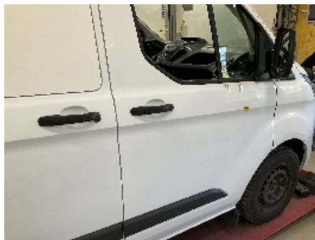
17. Lakk / karosseri utvendig