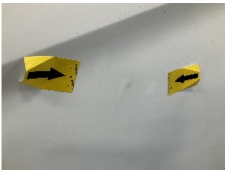
16. Lakk / karosseri utvendig