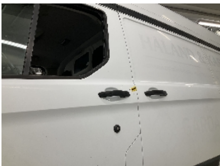
7. Lakk / karosseri utvendig