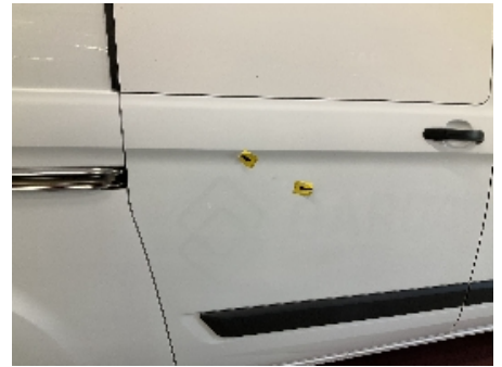
15. Lakk / karosseri utvendig