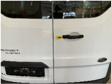
13. Lakk / karosseri utvendig