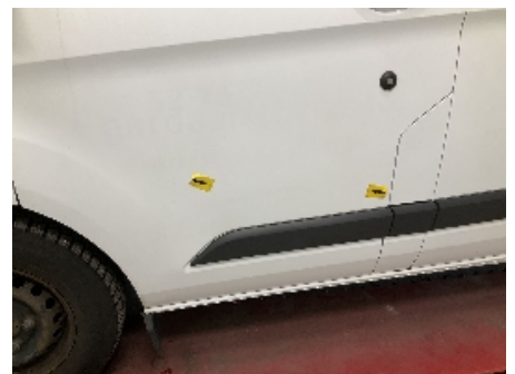
9. Lakk / karosseri utvendig