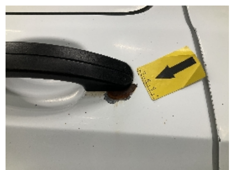
24. Lakk / karosseri utvendig