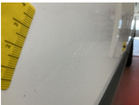
10. Lakk / karosseri utvendig