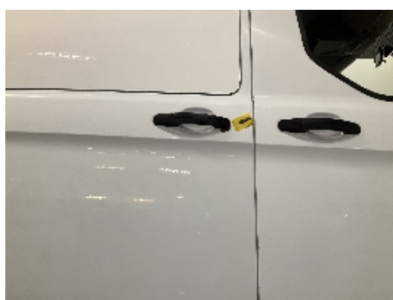
23. Lakk / karosseri utvendig