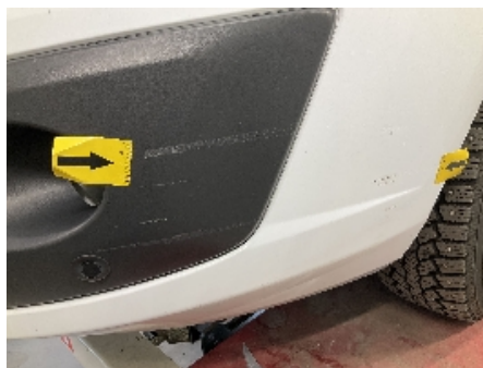
20. Lakk / karosseri utvendig