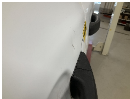
8. Lakk / karosseri utvendig