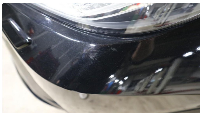
1.1 Øvrige feil