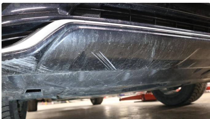
1.3 Øvrige feil