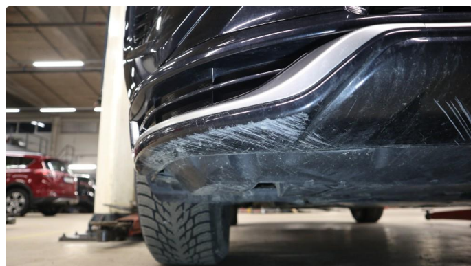
1.3 Øvrige feil