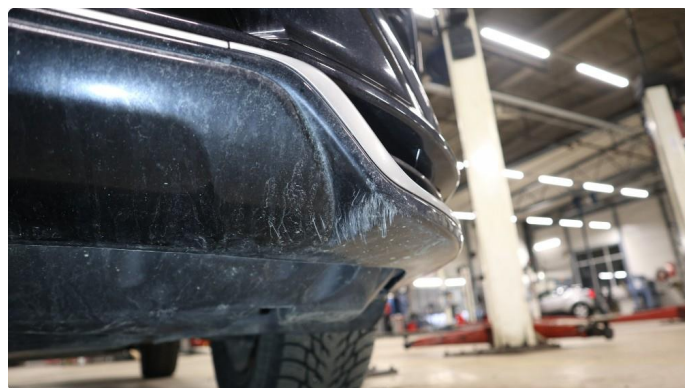
1.3 Øvrige feil