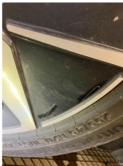
1.3 Påbegynnende oksidering