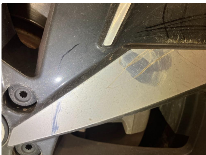
1.3 Påbegynnende oksidering