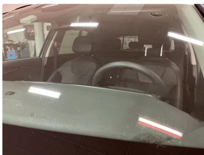
1.3 Lite steinsprang i frontrute