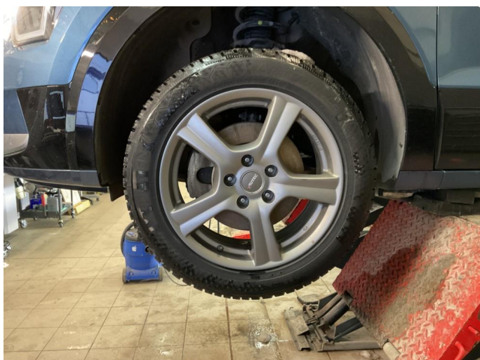
1.2 Bilder av vinterhjul