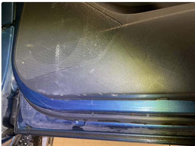
2.3 Små merker i dørtrekk