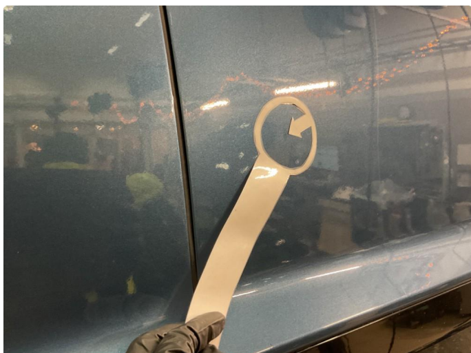
1.1 Liten ubetydelig parkeringsbukk