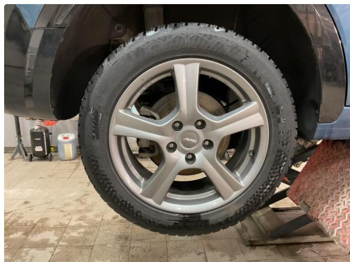
1.2 Bilder av vinterhjul