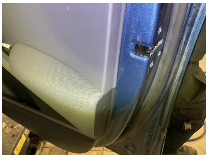
2.3 Små merker i dørtrekk