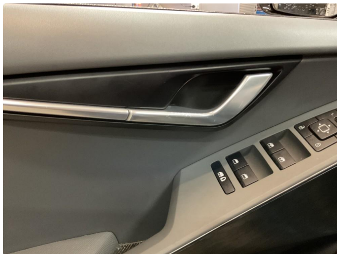
2.1 Små merker på dørhåndtak førerdør