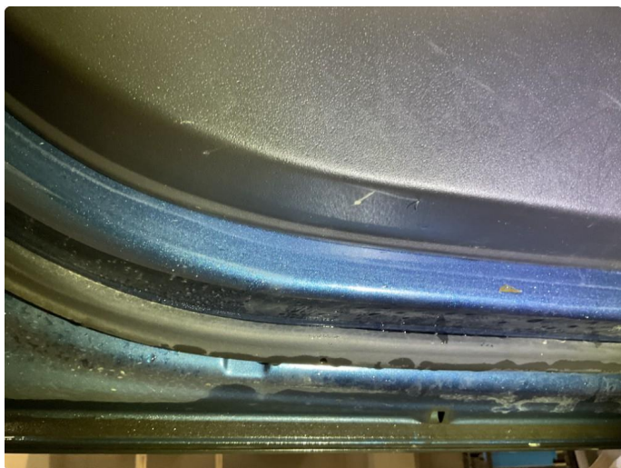
2.1 Små merker på dørhåndtak førerdør