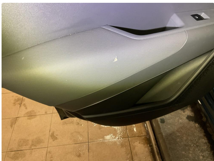
2.2 Lite merke i dørtrekk v/bakdør