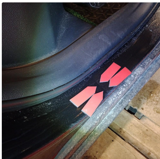
1.5 Bulker /m små lakkskader