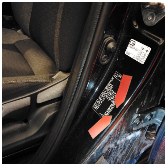
1.3 Bulk /m liten lakkskade