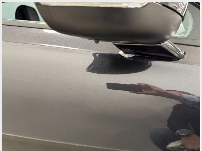
2.1 Liten rustflekk vsf og noe avskalling lakk under speil (se bilde)