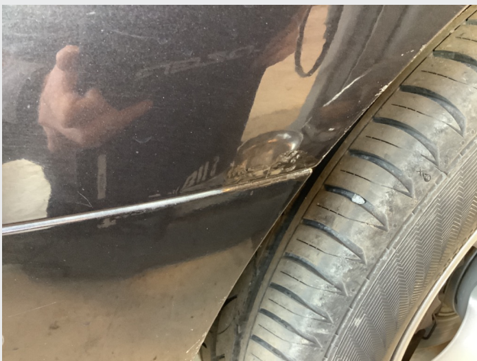
2.1 Liten rustflekk vsf og noe avskalling lakk under speil (se bilde)