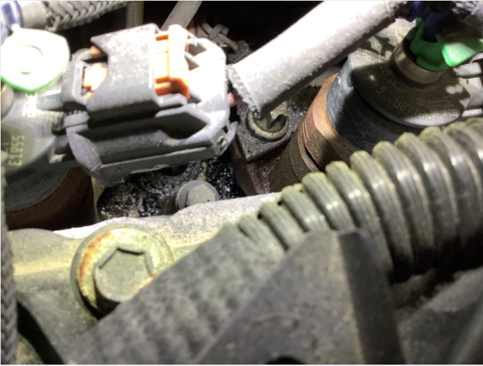
6.3 Litt oljesvetting ved toppdeksel - vasket rent