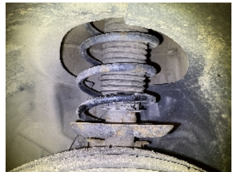
45. Fjærer / fjærbein