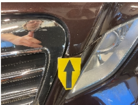
22. Lakk / karosseri utvendig