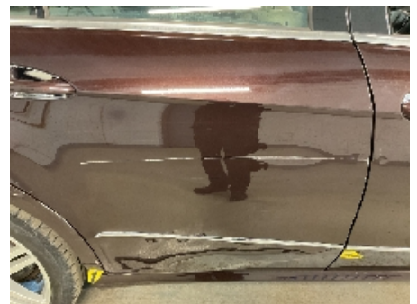
24. Lakk / karosseri utvendig