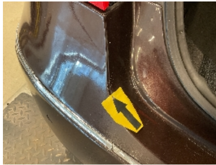
26. Lakk / karosseri utvendig