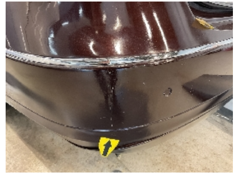
27. Lakk / karosseri utvendig