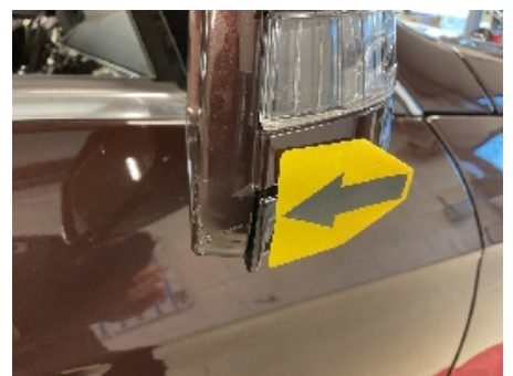
48. Lakk / karosseri utvendig