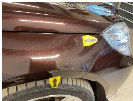
29. Lakk / karosseri utvendig