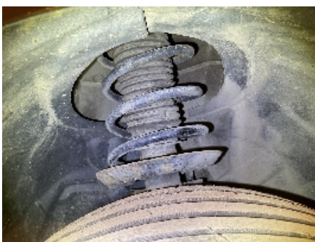
46. Fjærer / fjærbein