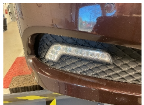
36. Lakk / karosseri utvendig