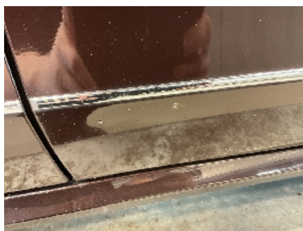
35. Lakk / karosseri utvendig