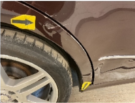
25. Lakk / karosseri utvendig