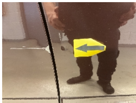
23. Lakk / karosseri utvendig