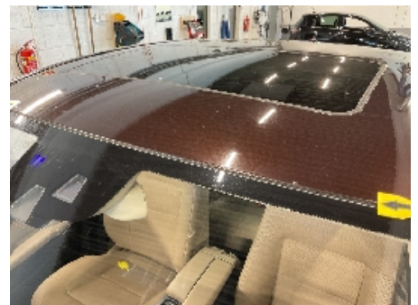
30. Lakk / karosseri utvendig