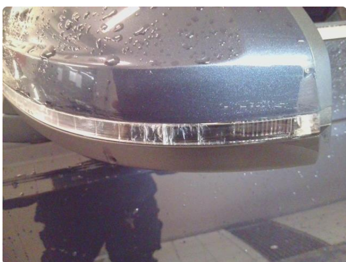
3.2 Krakelering i plast