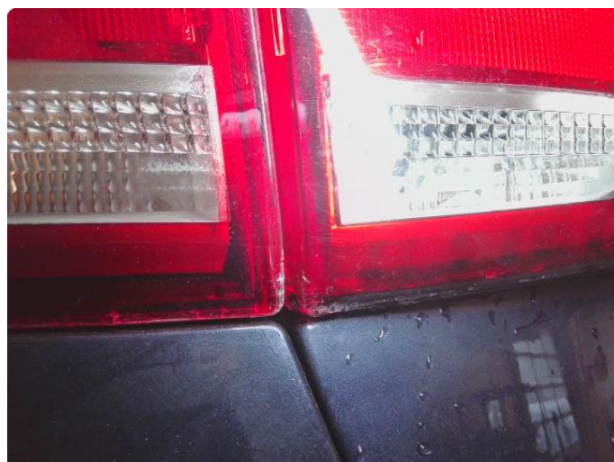
3.1 Krakelering i plast