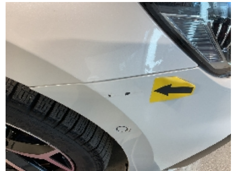
18. Lakk / karosseri utvendig