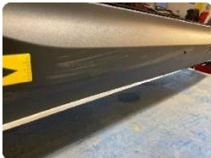
1.3 Skade på list