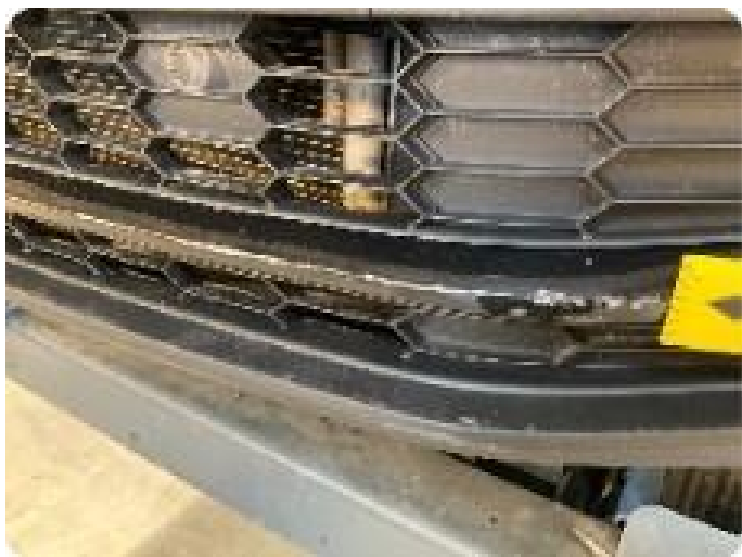
1.7 Skadet i plast