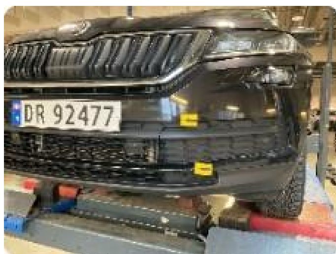
1.7 Skadet i plast