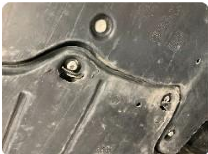
1.2 Skadet/løst plastdeksel