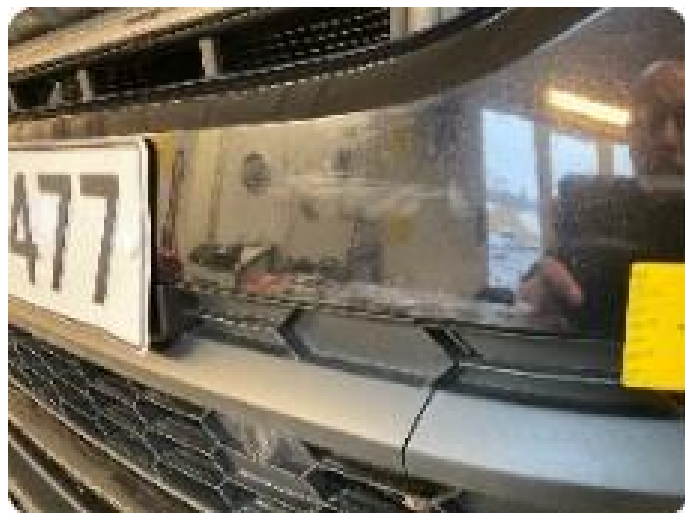
1.7 Skadet i plast