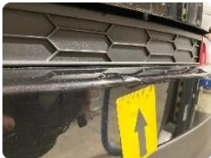
1.8 Skade i plast