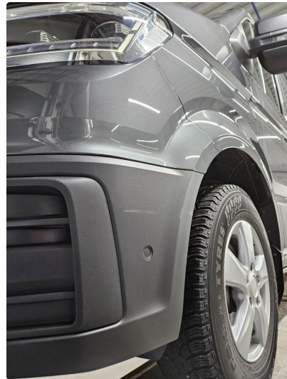
1.1 Noen bruksmerker på plastfangere foran/bak