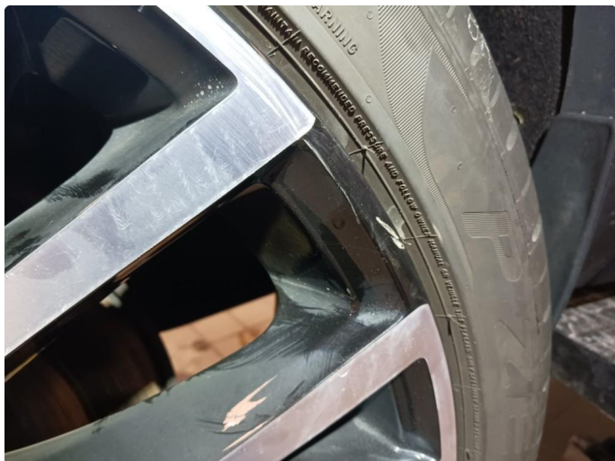
2.1 Kantkjørt felg