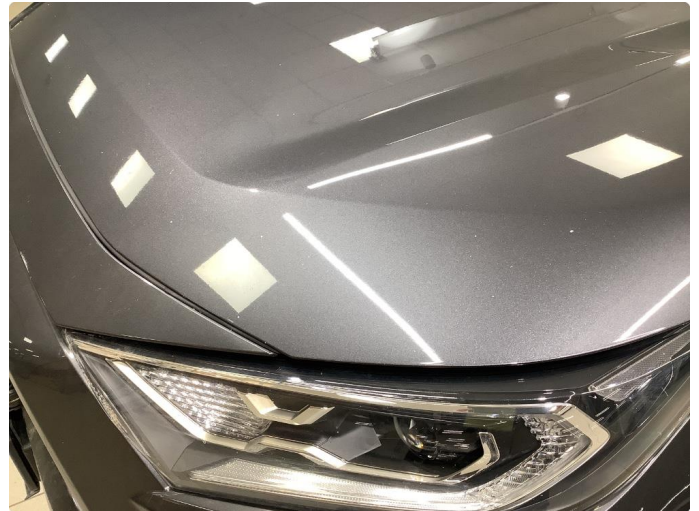
1.1 Mye stensprut