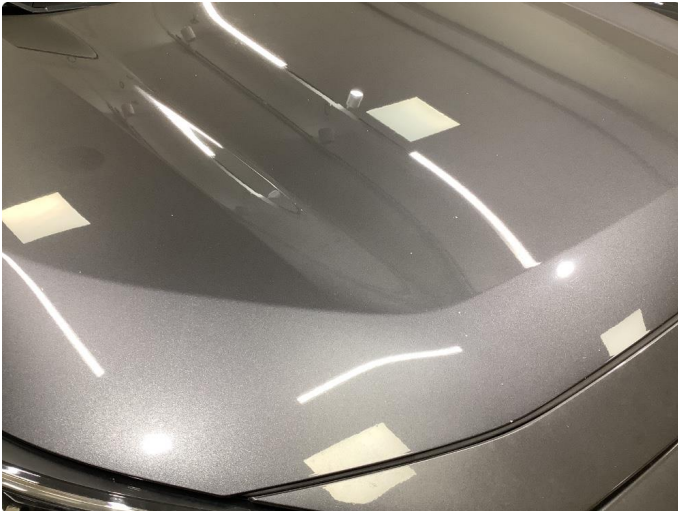
1.1 Mye stensprut