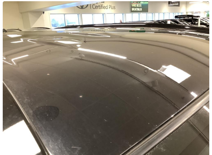
1.2 Steinsprut med rust