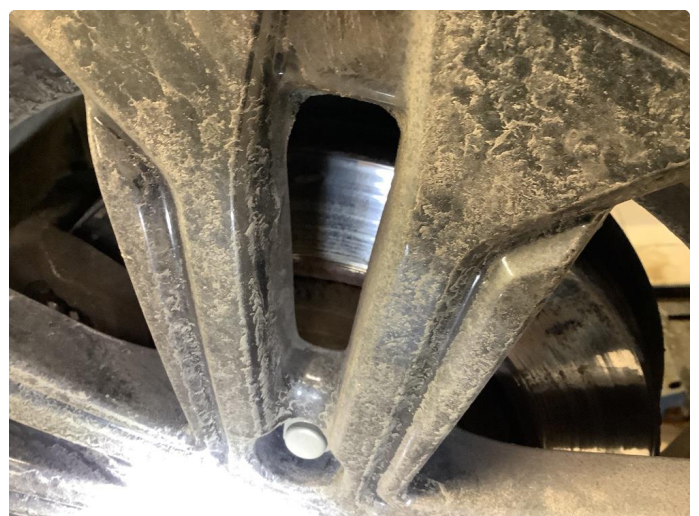
3.1 Slitte klosser