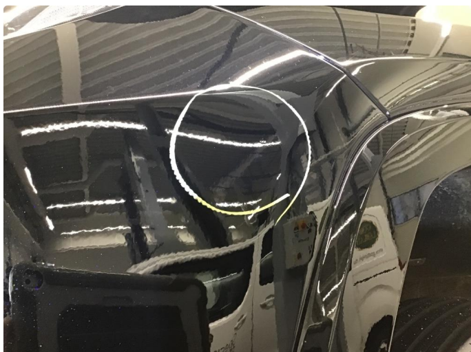
1.1 Ufagmessig utført arbeid