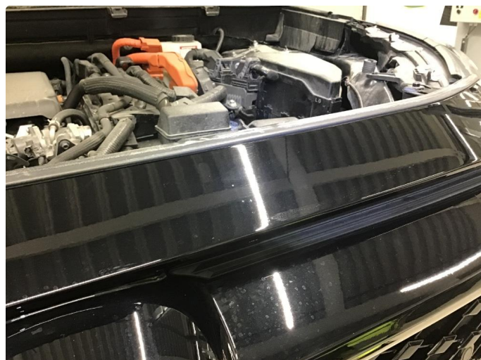
1.1 Ufagmessig utført arbeid