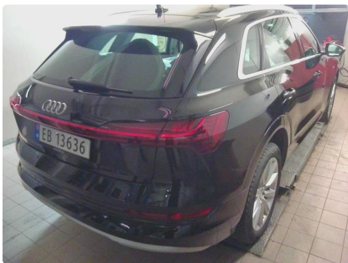
2.1 Diverse steinsprut og riper rundt på bilen.