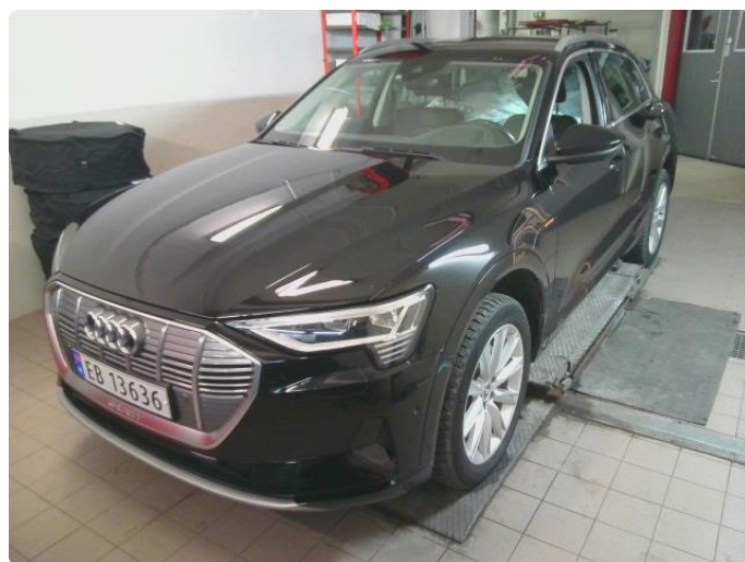
2.1 Diverse steinsprut og riper rundt på bilen.