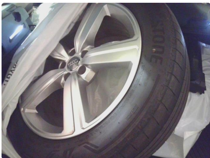
2.1 Diverse steinsprut og riper rundt på bilen.