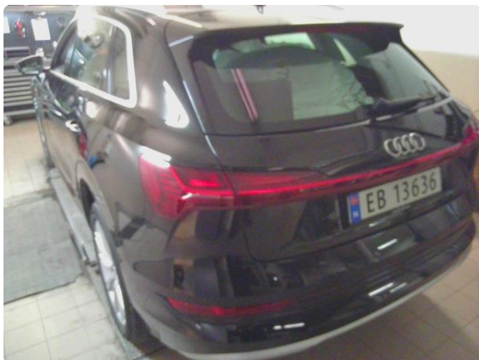
2.1 Diverse steinsprut og riper rundt på bilen.