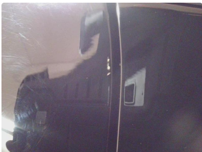
1.3 Lakk flasser