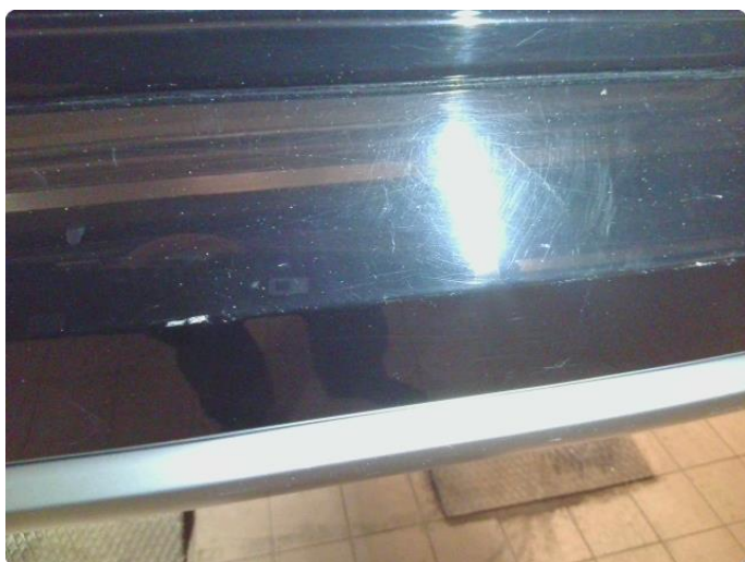
1.6 Lakk sår bakfanger