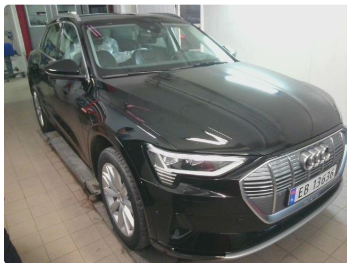
2.1 Diverse steinsprut og riper rundt på bilen.