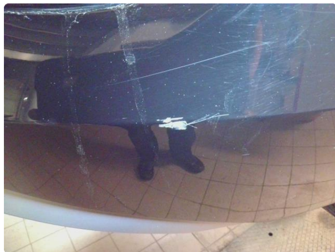
1.6 Lakk sår bakfanger