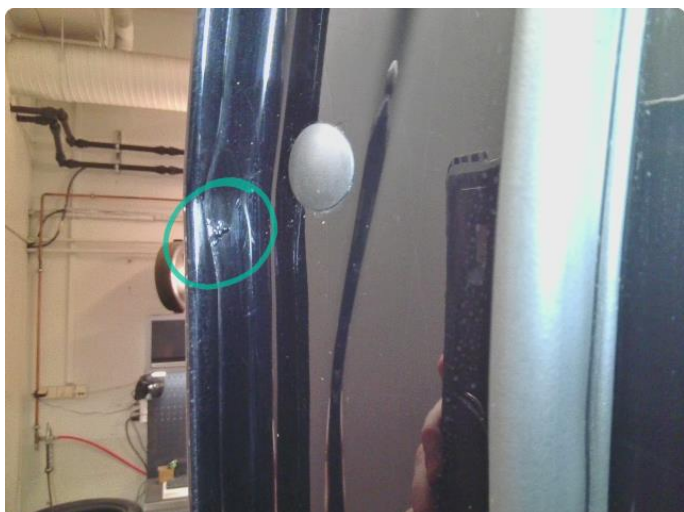
1.1 Rust i fals