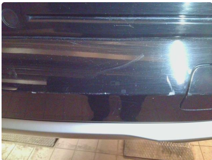
1.6 Lakk sår bakfanger