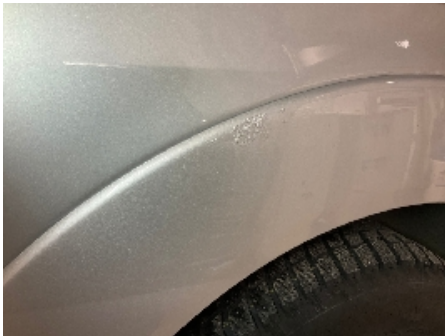
1. Lakk / karosseri utvendig