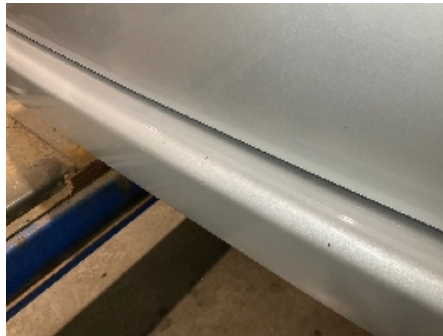
2. Lakk / karosseri utvendig