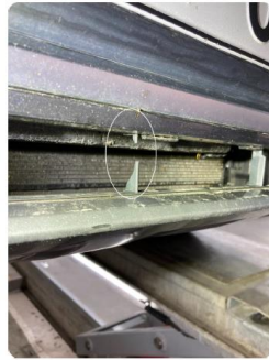
1.3 Defekte/knekte plast-spiler i nedre grill, foran