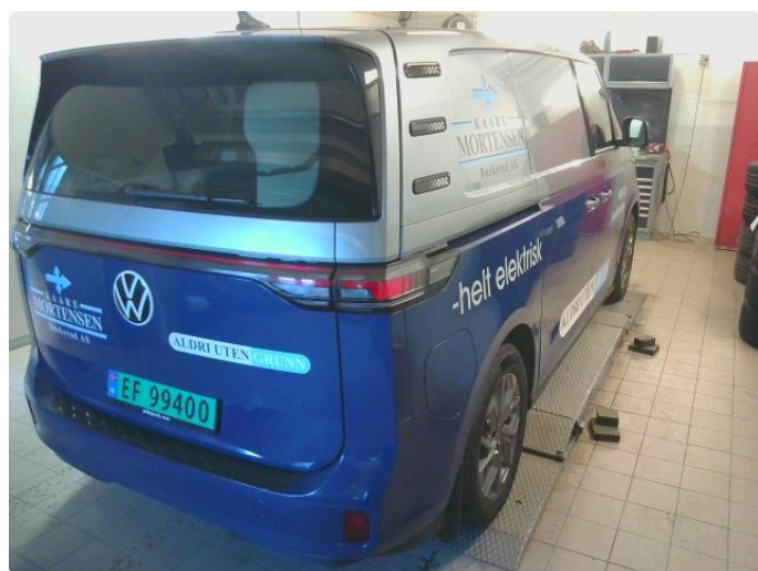
3.1 Øvrig opplysninger