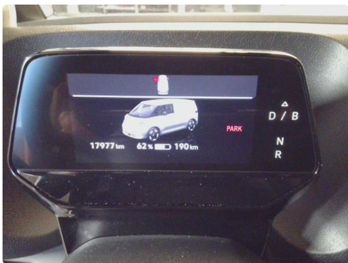
3.1 Øvrig opplysninger