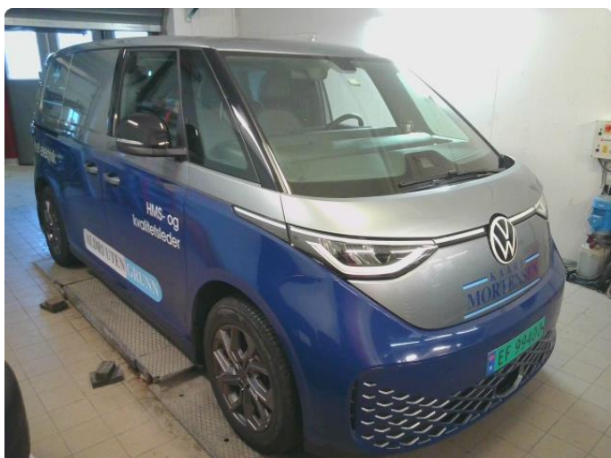
3.1 Øvrig opplysninger