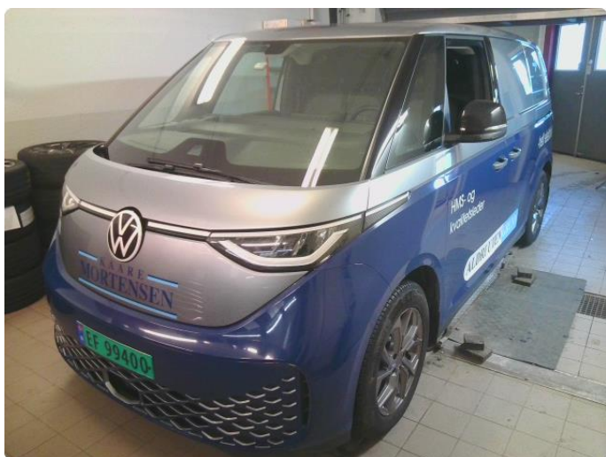
3.1 Øvrig opplysninger