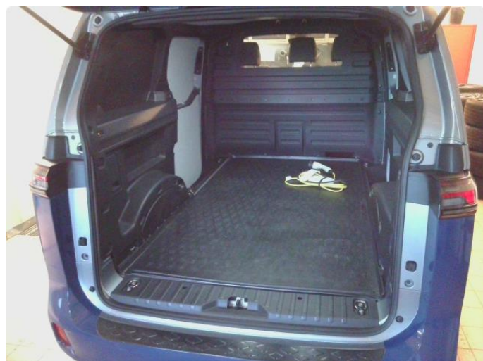
3.1 Øvrig opplysninger