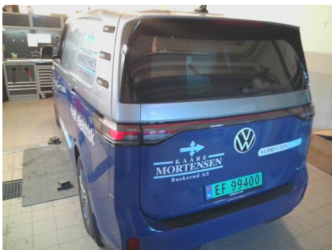
3.1 Øvrig opplysninger