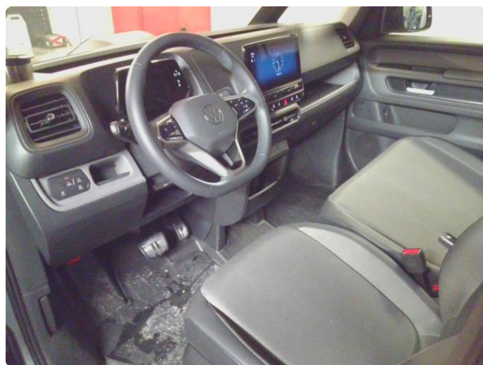
3.1 Øvrig opplysninger