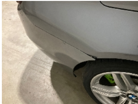
2. Støtfanger bak