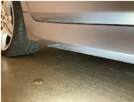
1. Lakk / karosseri utvendig