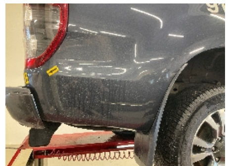
9. Lakk / karosseri utvendig