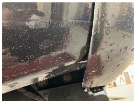
11. Lakk / karosseri utvendig