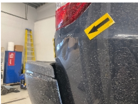
10. Lakk / karosseri utvendig